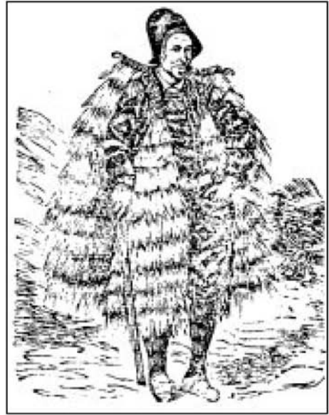
O Tío Marcos da Portela coa coroz na segunda etapa da revista do mesmo nome.

Valentín Lamas Carvajal (1854-1906), personaxe digno de respecto noutros terreos pero algo menos no da literatura, segundo o persoal punto de vista de quen isto subscribe, foi para eles modelo, guía e mentor de todo bo quefacer galeguista e literario. Certamente, ninguén, mesmo os que lle recoñeceron o seu traballo á fronte de varias empresas xornalísticas sen estar de acordo con el