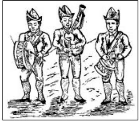
O enxebrismo como afirmación diferencial por medio do folclore.

Así as cousas, cando no ano 1916 ten lugar o importantísimo acontecemento da fundación das Irmandades da