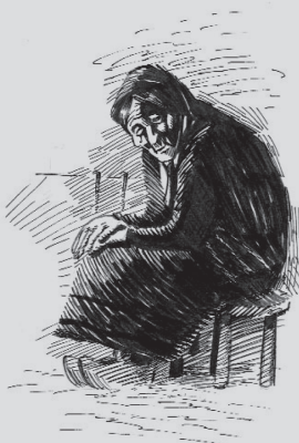
A velliña con párkinson movía os labios cantando as estrofas a canda nós, e unhas bagullas corrían polas súas meixelas.

Dixen que iamos un pouco á aventura porque había vintetantos anos que se deixara de practicar este costume. Nos pensábamos que era un xeito de esmorga coma corre-lo Antroido e, a fé miña que levamos unha boa lección.