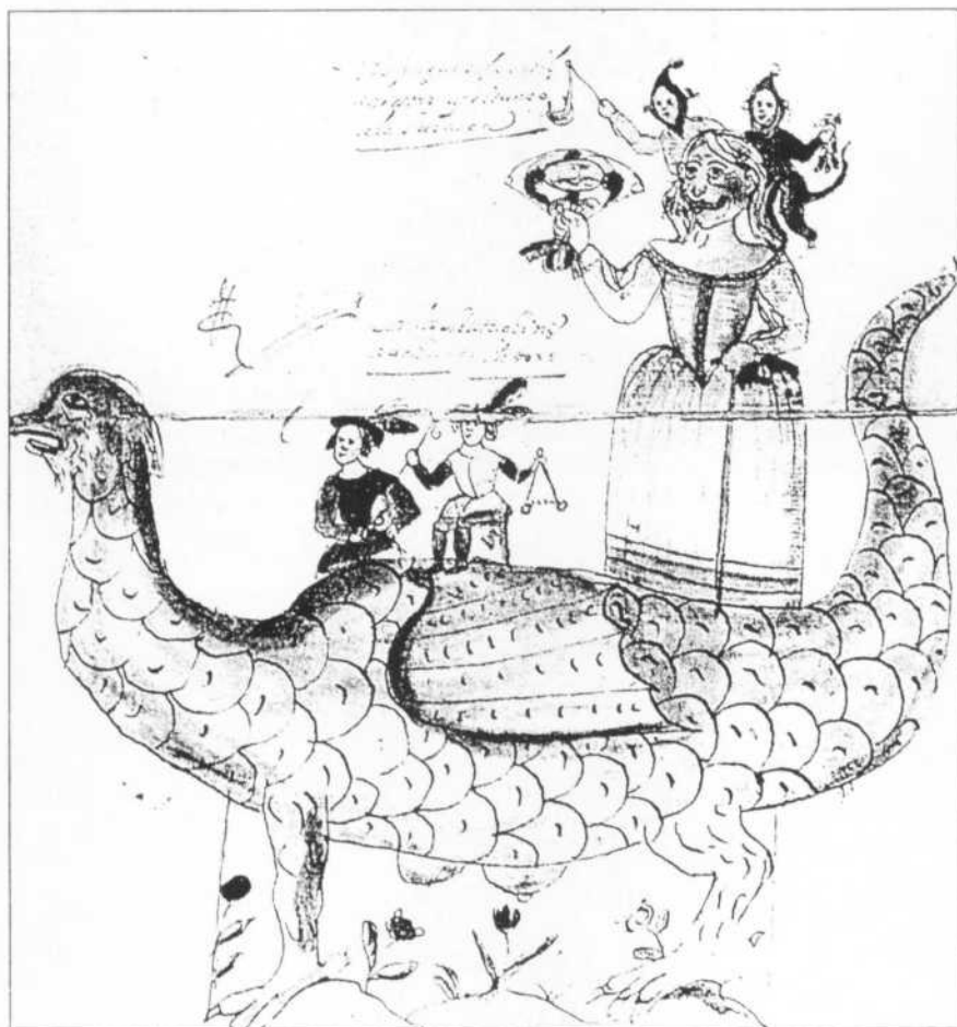
Lám. 1.- Boceto de una tarasca para las fiestas del Corpus. Madrid, año 1667. Obsérvese la semejanza de las figuras que aparecen encima de la tarasca, con la imagen de la lámina 3.