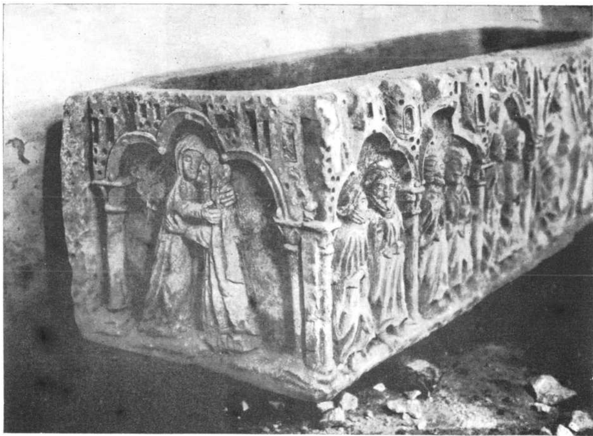
CARRION.—Angulo del sarcófago de tres lados esculpidos.