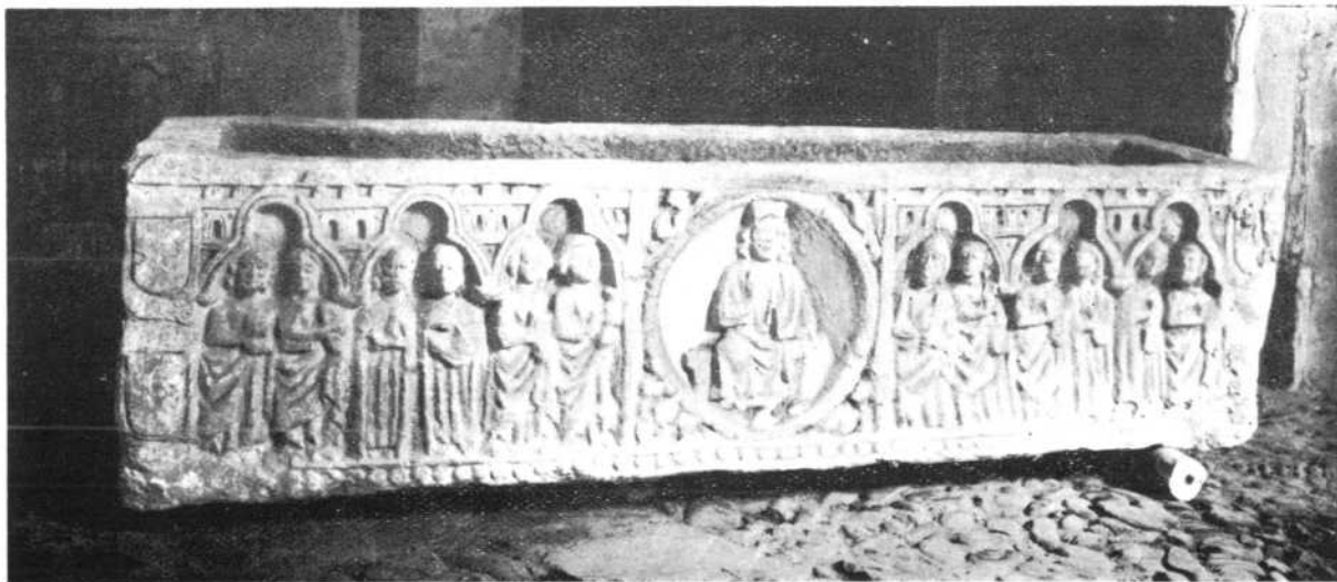
CARRION.—Sarcófago románico. Cristo Majestad.