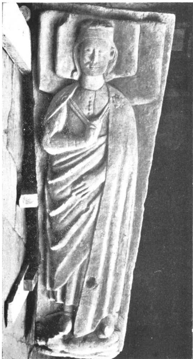
CARRION.—Laude sepulcral: siglo XIII.