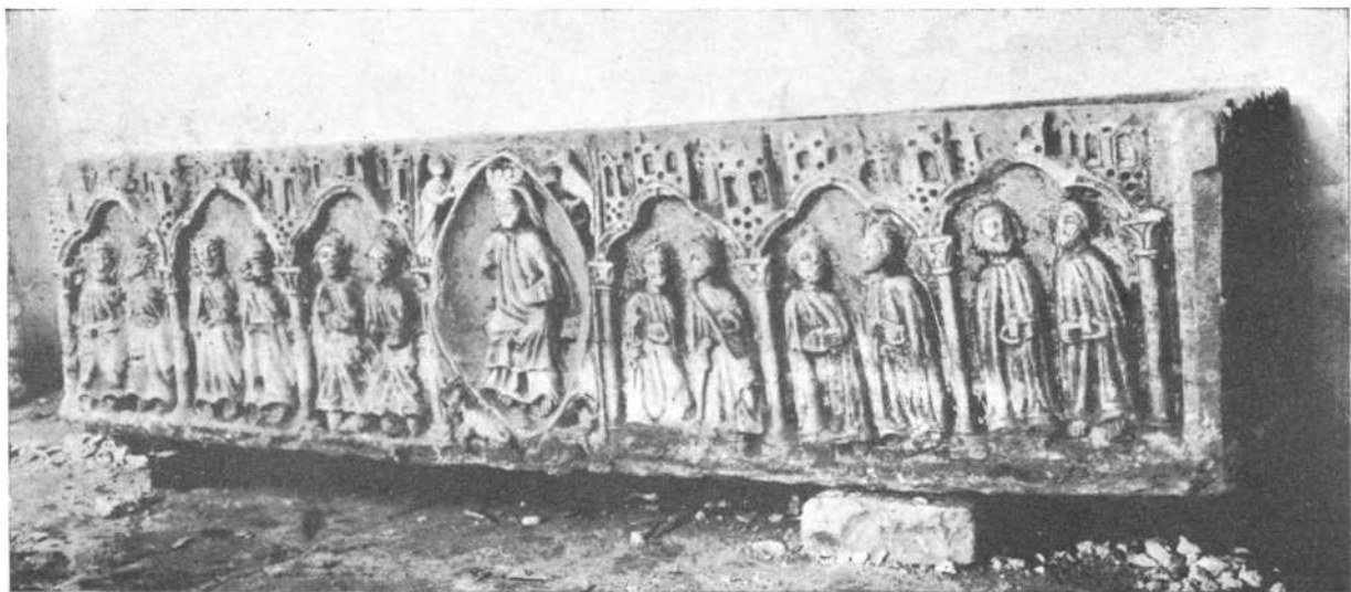
CARRION.—Sarcófago románico con tres lados esculpidos.