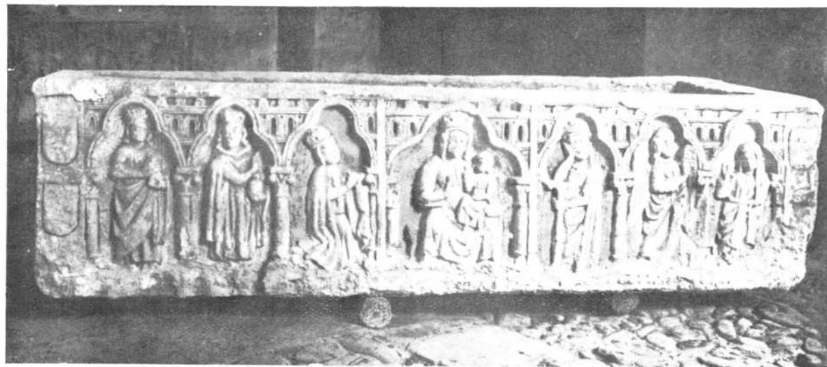
CARRION.—Sarcófago románico. La Virgen Santísima.