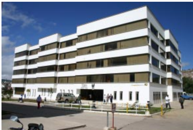
Edificio Administrativo Universidad Pedagógica y Tecnológica de Colombia

Con la información presupuestal recopilada en los anteriores apartados sobre la universidad, fue posible calcular las cifras del costo por estudiante y dependencia, desde la misma institución para confrontarlas con las investigaciones de ASCUN, sobre el gasto público en la educación superior para la época.