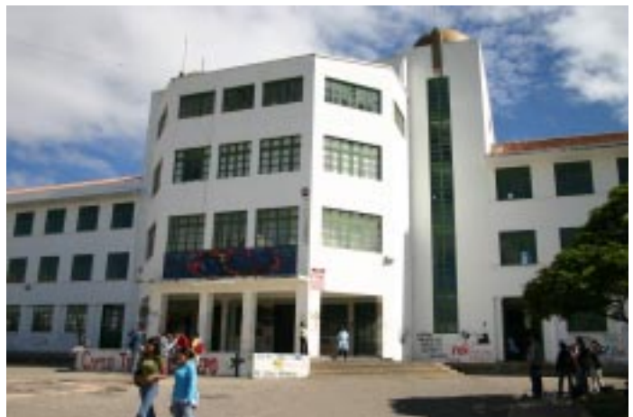
Detalle Edificio Central Universidad Pedagógica y Tecnológica de Colombia

En este contexto, la investigación en las áreas de la educación y la economía están relacionados y se presentan de acuerdo con la contribución que la economía pudo prestar a la investigación en el ámbito de la educación, sobre todo en el análisis del funcionamiento y resultado de los sistemas educativos. Campo de investigación más conocido como: La economía en la educación , la cual tuvo en cuenta por una parte, como los sistemas educativos poseen, o le son asignados, recursos limitados para el cumplimiento de sus objetivos. Estos pueden ser humanos, materiales o financieros, generalmente escasos, que eran asignados para alcanzar las metas del sistema de la mejor forma posible 1 .