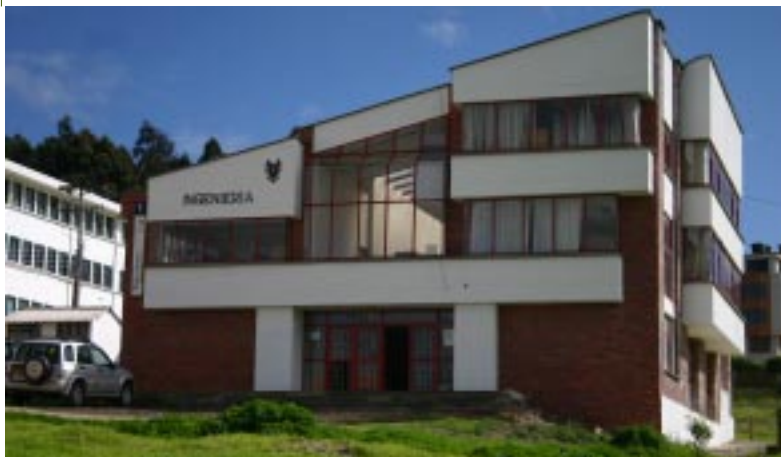
Edificio Facultad de Ingeniería Universidad Pedagógica y Tecnológica de Colombia

gastos para otros niveles de enseñanza, era compensado debido a que estas dependencias anexas, le servían como lugar de prácticas y suministrar los futuros alumnos, al nivel de enseñanza superior.