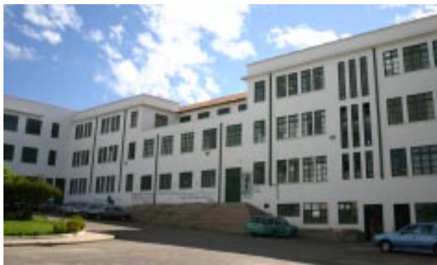
Detalle Cara Occidental. Detalle Edificio Central Universidad Pedagógica y Tecnológica de Colombia.

A manera de conclusión, se determina el costo real promedio por estudiante para cada año en la Sección Universitaria. En los años de 1955 y 1957, se comparan las dependencias, la proporción de estudiantes, el presupuesto ejecutado, el costo por alumno, el número de docentes y empleados, y los correspondientes índices de crecimiento. De esta manera, se