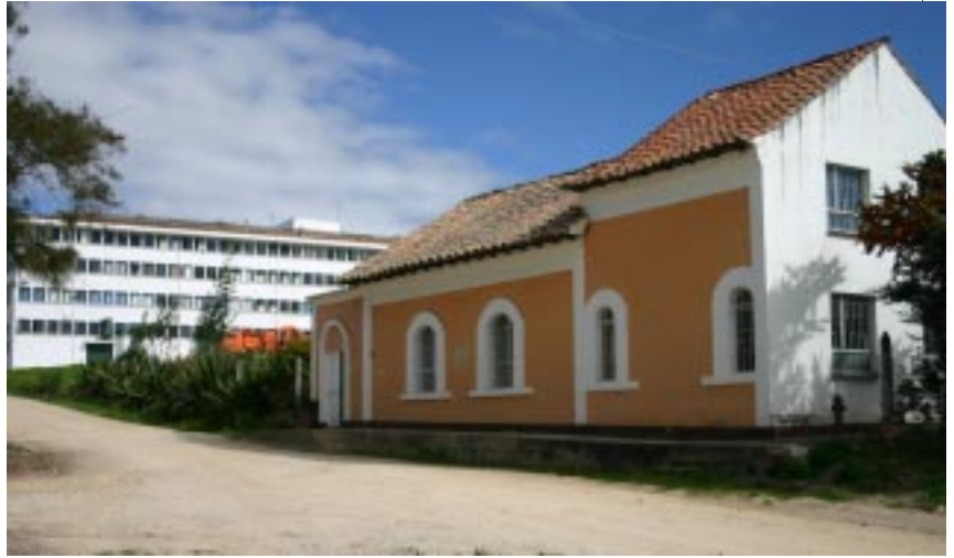
Sede Postgrado en Archivística Universidad Pedagógica y Tecnológica de Colombia

pasaban a aumentar el del año siguiente. Dada la autonomía de la institución no devolvió fondos al Tesoro Nacional. 25 La explicación que sea el concepto: Saldo de las Apropiações o Saldo Aprovechable para la Vigencia siguiente, y no el superávit entre rentas y gastos se debe tal vez, el considerar que lo Apropriado y no Gastado, quedó como recursos que debían ser Recaudados más tarde y por lo tanto gastados.