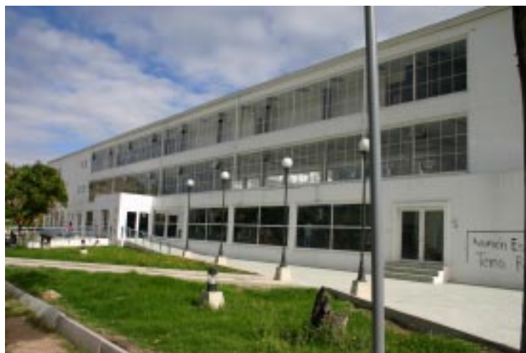
Detalle Edificio de Admisiones Universidad Pedagógica y Tecnológica de Colombia

La metodología en este estudio, fue la misma de la Historia de la Educación, la cual se relacionó con la Historia Económica; donde los cambios institucionales se dieron paralelamente a los cambios económicos. Los conceptos y métodos de la historia económica, resultaron imprescindibles para investigar aspectos internos de un centro educativo como la Universidad Pedagógica de