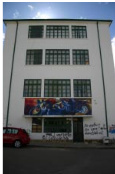
Detalle Costado Occidental Universidad Pedagógica y Tecnológica de Colombia

En este apartado, busco examinar la ejecución de gastos realizados de toda la Universidad y por dependencias, mostrando cuál fue la dinámica en cada una en los egresos en cuanto a sueldo del personal docente y administrativo, gastos generales y/o becas y alimentación, construcciones e inversión, y otros gastos varios. Allí se observó como algunas dependencias 14 permanecieron en todo el período en estudio, otras fueron creadas y otras eliminadas. Enseguida, se estudió los dineros según su destinación bien para funcionamiento o para inversión. En los de funcionamiento, se encuentran: servicios personales, becas y alimentación, gastos generales y otros rubros no determinados, por adiciones presupuestales posteriores.