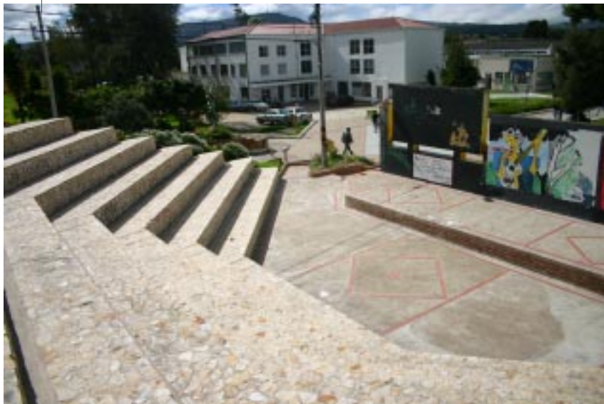
Plazoleta Universitaria Universidad Pedagógica y Tecnológica de Colombia