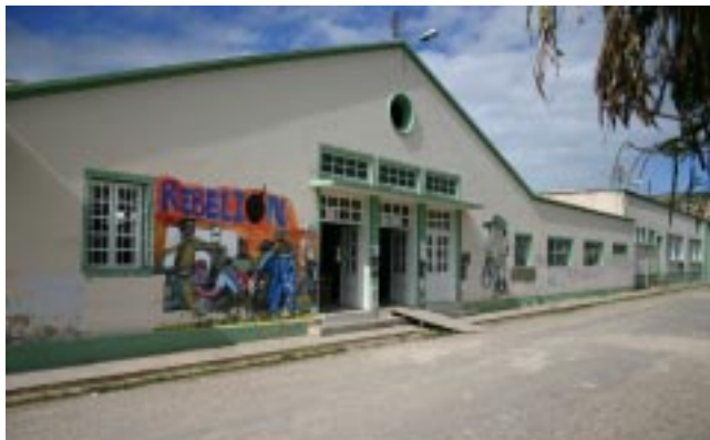
Restaurante Estudiantil Universidad Pedagógica y Tecnológica de Colombia

En el Cuadro No. 2 . De las cuentas en pesos constantes y reales se puede deducir brevemente, 17 a partir de la estructura porcentual y los índices de crecimiento del gasto por dependencias y por destino de la Universidad, como los objetivos propuestos en su creación era la preparación de profesores idóneos para servir eficazmente la enseñanza en las distintas ramas y especialidades de la educación pública y su vinculación al creciente desarrollo industrial y agrícola del país. Era una Institución Pedagógica para el magisterio colombiano y su misión era de alcance Nacional . Si revisamos el cumplimiento de estas metas, encontramos que uno fue el espíritu del Decreto-Ley 2655 del 10 de octubre de 1953, e interpretación de la historia de la entidad, y otra fue la realidad de estos primeros años de funcionamiento.