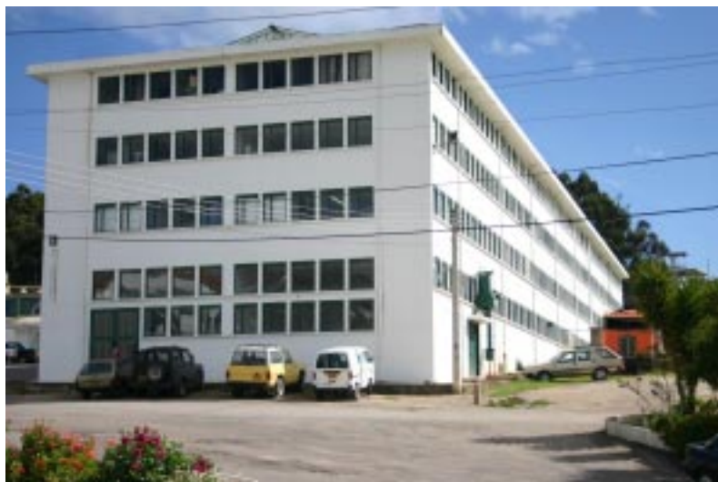
Detalle Edificio de Laboratorios Universidad Pedagógica y Tecnológica de Colombia

Desde el punto de vista de los índices de crecimiento de los gastos, por dependencias y según destino, se confirma la tesis anterior, mientras los egresos de la Universidad se incrementaron en un promedio anual del 67.6% en los años de 1953 a 1956, por el contrario los recursos de las entidades pedagógicas como la Sección Universitaria decrecieron en estos años en un promedio anual del 29% y de la Escuela Normal Superior, sólo se incrementaron en un 11.5% por año. Esta situación contrasta con dependencias como la Dirección General donde los recursos se incrementaron anualmente en un 20%, el Instituto Pedagógico Agrícola de Paipa con un 564% anual, la Escuela Normal Rural del Valle de Tenza, la cual debía ser anexada al Instituto, cuyos gastos se incrementaron en un 73.5% por año. La obligatoriedad, emanada por el Decreto –Ley de crear un Instituto Industrial, trajo consigo la eliminación de la Escuela de Artes y Oficios de Tunja, y el de Duitama, decreció sus gastos en un 21.4% en los dos últimos años observados en la investigación. El Centro Indígena de “El Sol” en Sogamoso, sus recursos desde el primer año decreció, igual