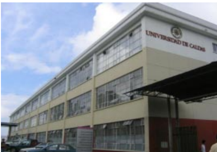
Universidad de Caldas Manizales - Colombia

PRIMERA. Objeto. Establecer las bases específicas del convenio multilateral de cooperación del programa de “Doctorado en Ciencias de la Educación con énfasis en Historia de la Educación”, entre las universidades participantes. SEGUNDA. El Programa de Doctorado. Su definición y especificidad académica, científica, administrativa y financiera corresponden al documento aprobado por el Consejo Superior de la UPTC que se adjunta