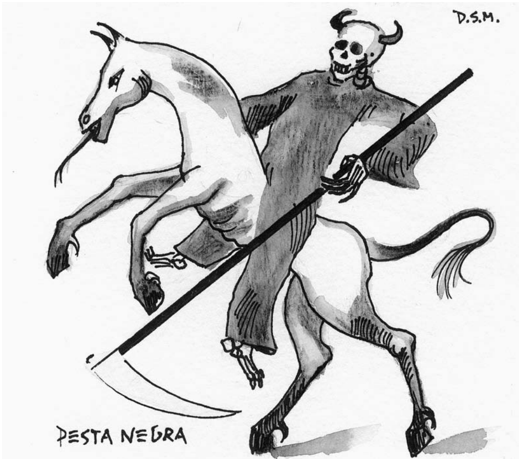
Il·lustració: Domènec Serra.

cerle. Al no existir una gran producció rural i sí gran demanda, els preus es van tornar a incrementar cosa que va provocar carestia d'aliments i conseqüentment la fam.