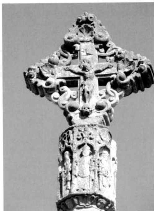
Fig. 22 Creu de Llorenç de Vallbona

La segona de les creus citades és la de la població de Castelserà (Fig. 21), datada entre els segles XIV-XV. És una creu sostinguda per un peu vuitavat i encaixonat per una alta base esglaonada. Sobre del fust s'hi adossa un nus allargassat i octogonal decorat amb el relleu de figures bíbliques separades per arcs apuntats sostinguts per columnes. Aquests personatges es troben sobre una petita cornisa, a sota de la qual hi ha esculpits quatre escuts flanquejats per rostres.