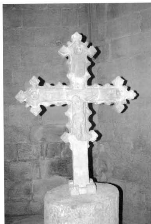
Fig. 17 Creu de les Eres de Verdú

La creu és de gran elegància pel que fa a les seves característiques formals. Es classifica dins la tipologia de braços flordeliselats, ja que a l'extrem dels seus braços rectilinis hi ha un motiu decoratiu molt elegant: tres fulles de flor de lis. Pel que fa al centre de la creuera, a una banda hi ha Crist Crucificat i a l'altra la Mare de Déu coronada, sostenint el Nen Jesús a la seva mà esquerra.