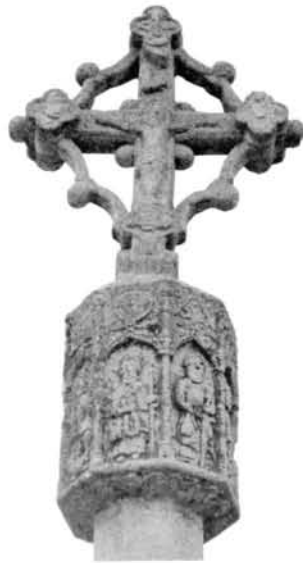
Fig. 10 Creu de Bellver d'Ossó

(Fig.10), la qual és datada a l'any 1517, dins d'un gòtic tardà. Sobre una graonada de dues escales i una base quadrangular s'aixeca un fust octogonal sobre el qual hi ha la presència d'un magnífic nus en forma vuit cares. En cada una d'elles, tal i com és habitual, hi ha la presència de vuit sants separats per columnes i coberts per arcs apuntats.