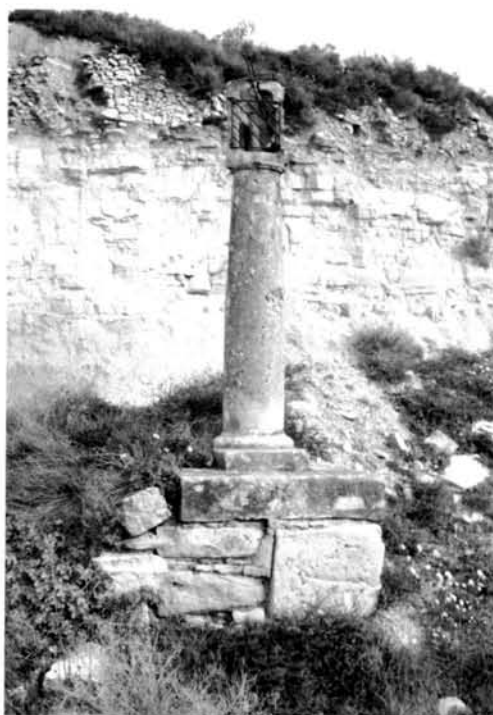
Fig. 15 Creu-Pedró del camí de la Bovera de Guimerà

A la comarca no s'ha trobat cap testimoni d'aquestes característiques, almenys avui conservat.