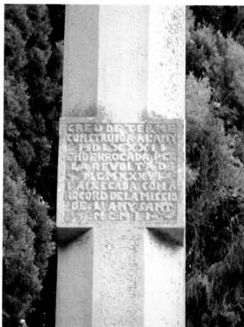
Fig. 13. Creu de Santa Anna d'Anglesola

Un segon exemple classificable dintre aquesta tipologia és la Creu de Santa Anna d'Anglesola