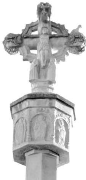
Fig. 11 Creu de la Fuliola

Es tracta d'una creu de pedra composta d'una base amb tres graons quadrangulars que sostenen un arbre hexagonal, amb una característica innovadora: és la presència d'un escut adossat a la part central del fust, el significat del qual es desconeix. El nus o capitell és octogonal i a cada una de les vuit cares presenta, dins una fornícula amb arc de mig punt, vuit sants tots ells relacionats amb les tradicions de la vila. Són Santa Lúcia, Santa Anna, Sant Esteve, Sant Sebastià, Sant Anna, Sant Esteve, Sant Jaume Apòstol i Sant Armengol. S'ha d'apuntar, però, que cada un d'ells no correspon als que haguéssim trobat en la creu original. Segons l'autor, en la part del capitell només van poder distingir, mitjançant una fotografia, Sant Pere i Sant Miquel. 37