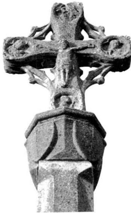
Fig. 8 Creu de Sant Eloi de Tàrraga

Un altre exemple a destacar d'aquest grup podria ser la creu situada al parc de Sant Eloi de la ciutat de Tàrraga, dita anteriorment Creu de Morlans i col·locada en el camí vell de Balaguer (Fig. 8). Està erigida dins una graonada de tres escales que encerclen un sòcol quadrangular. El canó és poligonal vuitavat però, en canvi, el capitell és quadrat. En cada una de les cares d'aquest nus s'hi adossa un escut piramidal molt simple, absent de decoració i dividit per una aresta vertical que el travessa per la meitat. Els quatre braços de la creu en què a l'anvers hi ha Crist Crucificat i al revers la Verge amb el Nen, finalitzen amb la decoració de quatre medallons lobulats escul-