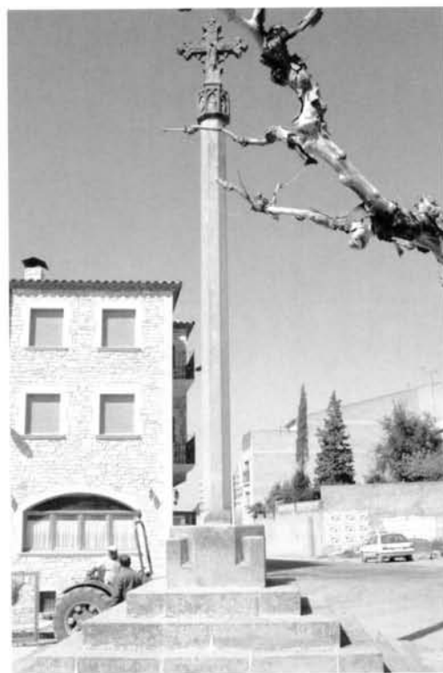
Fig. 16 Creu de Sant Miquel de Verdú

La cronologia de totes elles rau entre principis del segle XIV i finals del XV, englobant-les dins l'estil gòtic.