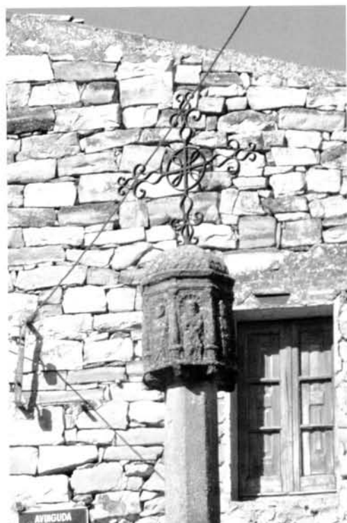
Fig 14. Creu de Nalec

A la comarca se n'han trobat molt poques i generalment són als cementiris. N'hi ha, però, que tenen altres ubicacions com la creu de davant l'església de Guimerà, que actualment és de ferro, però havia sigut de pedra amb braços rectilinis si observem la fotografia de 1919 de l'inventari d'Albert Bastardes. 44