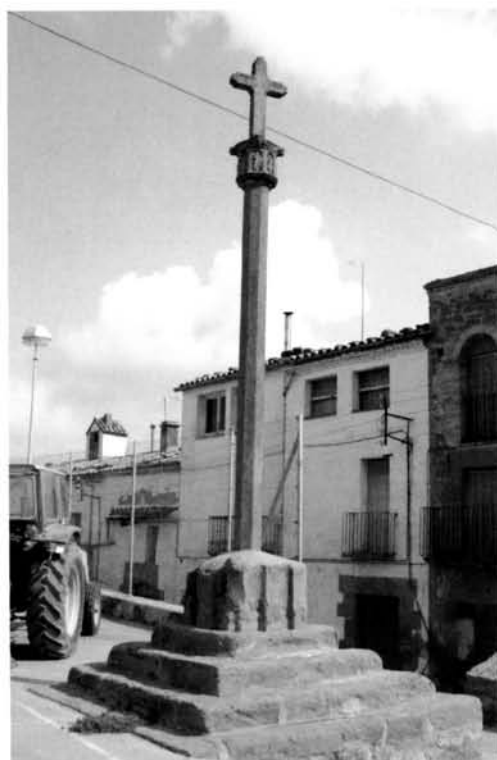
Fig. 20 Creu d'Ossó de Sió

amb simples motlures sobresortints en els vèrtexs i en els extrems dels braços.