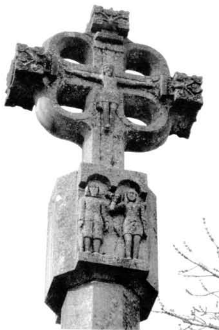
Fig. 2 Creu dels quatre ulls o Foradada de Guimerà

Un exemple a la comarca de l'Urgell n'és la Creu dels Quatre ulls o Foradada, ubicada aproximadament a dos quilòmetres al nord de la població de Guimerà, la funció de la qual era la de separar i remarcar els dos termes municipals de Guimerà i de Ciutadilla. Un altre, també dins el terme de Guimerà, és una creu situada en una intersecció de quatre camins, a prop del Santuari de la Bovera. Aquesta última podria ser classificada com una creu de tipologia caminal o de cruïlla, però també es podria interpretar com a fita-