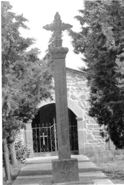
Fig. 6 Creu de les Forques/ del Faldar o de la falda de Sant Pere d'Anglesola

Si ens fixem en cada una de les creus plantades en els cementiris de la comarca de l'Urgell són, la majoria, bastant simplistes ja que manquen d'ornaments decoratius si les comparem amb la resta. Un exemple és el cas d'una creu de fossar de la població d'Ossó de Sió (Fig. 5). Aquesta es compon d'un sòcol totalment quadrangular on s'hi sustenta un fust vuitavat. El nus de la creu és de gran senzillesa, ja que és decorat només amb un registre de puntes de diamant que fa de llit al que és la creu pròpiament dita. Aquesta, sostinguda per un petit cos acampanat amb relleus vegetals, mostra un Sant Crist a la part davantera i al revers la Mare de Déu. Com a