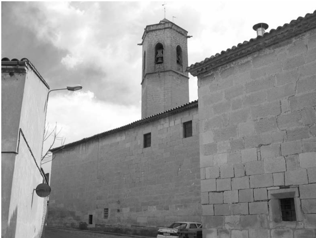
Exterior de la capella dels Dolors de l'església parroquial de Bellpuig.

sualitzar i realçar la façana, al contrari del que succeeix a Maldà, on la monumentalitat de la façana de l'església parroquial queda desvirtuada per la seva ubicació en un carrer estret, sense que sigui possible apreciar-la en tot el seu esplendor. S'estableix en aquest cas, doncs, un paral·lelisme entre les esglésies de Bellpuig (o Granyena) i l'església de Maldà, en relació amb les catedrals de Girona i Tortosa; la primera de les quals se'ns apareix notablement valorada per l'efecte escenogràfic que li proporciona l'escalinata, mentre la monumental façana de la segona resta amagada i sense perspectiva, entre la Costa dels Capellans i el carrer de la Creuera.