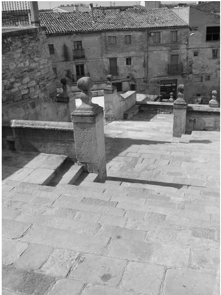
Escalinata de la parroquial de Bellpuig (detall).

les actuals comarques de l'Urgell, Pla d'Urgell i les Garrigues –Puigverd d'Agramunt, Maldà, Palau d'Anglesola, Castellnou de Seana, Golmés, Ivars, l'Espluga Calba...–; mentre les úniques esglésies de tres naus que documentem a la Segarra són la de Guissona i Granyena –exceptuant, és clar, la capella del paranimf de la Universitat de Cervera, que tractarem individualment més endavant. En la causa d'aquest fet hi trobem la cronologia –les tres naus predominen a partir de la segona meitat de segle i més concretament durant l'últim terç– i la situació geogràfica, que la fa una zona més influenciable per la construcció de la catedral de Lleida, començada l'any 1760.