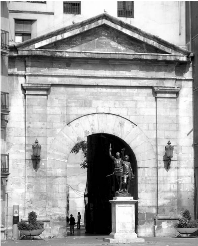
Arc del Pont de Lleida, en una imatge dels anys setanta.