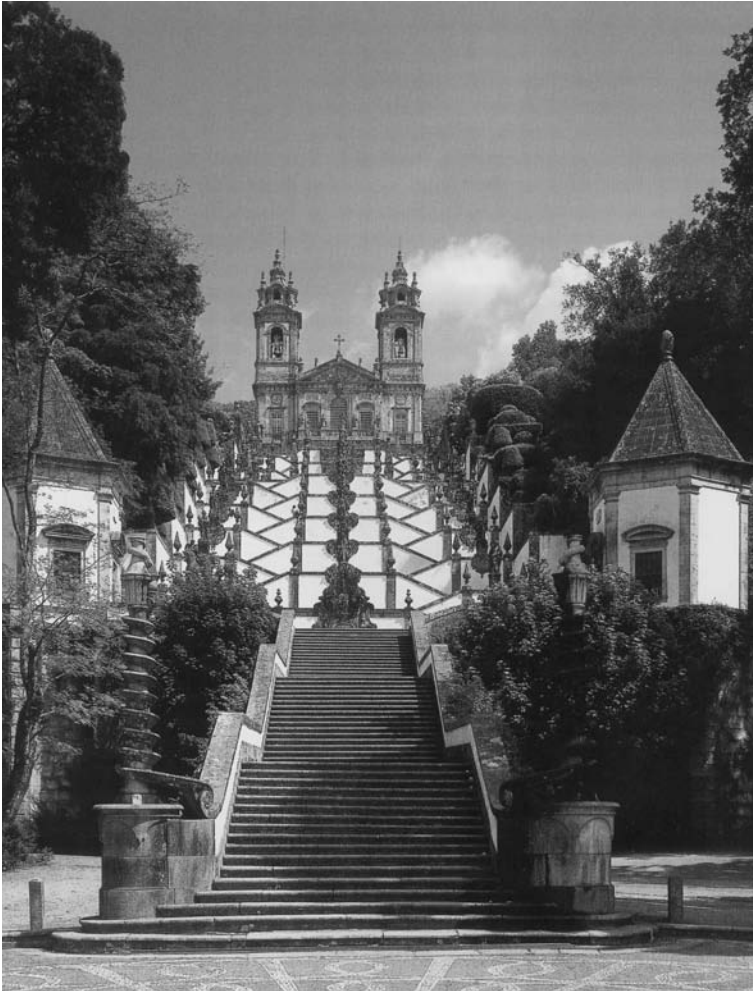
Escalinata del santuari de Bom Jesus do Monte, a Portugal.