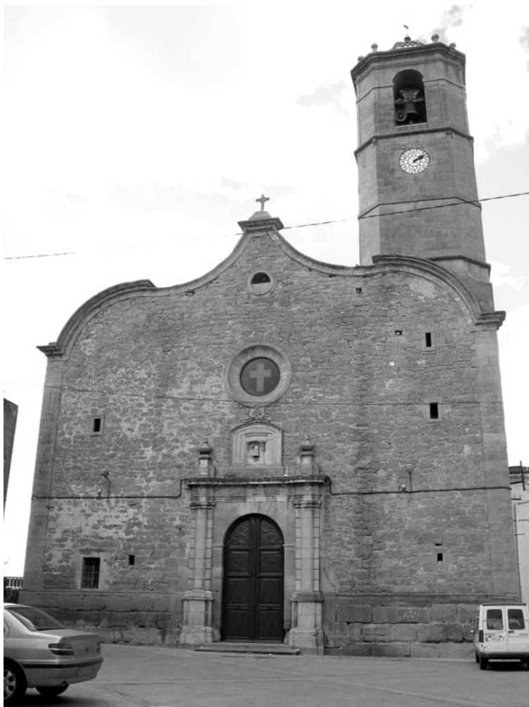
Església de Puigverd d'Agramunt.

El més freqüent a les terres de Lleida i en aquesta època –segona meitat del segle XVIII– era que fos l'Ajuntament –més que no pas la parròquia– qui es fes càrrec de les obres de la nova església. S'endegava llavors un procés de gestions que anaven des de la formació de la comissió per a l'administració i direcció de l'obra fins a demanar el permís per disposar d'una part del fruit de les collites –que podia anar des d'una novena part fins a un "vintiquatre" i fins i tot "quarantavuité"–. 20 D'aquesta manera els regidors de Puigverd d'Agramunt presenten un memorial al comte de Ricla exposant el següent davant la urgència d'haver de construir una nova parroquial: " Y respeto que los Regidores y Particulares del comun de Puigverd no tienen fondos del comun para cumplir en la construcción de la nueva iglesia, ni ahun para la ampliación de la actual, dezeando como dezean cumplir los expresados mandatos (...) a fin de otorgar juntos los necesarios poderes y demás publicos instrumentos que menester sean para suplicar a la Piedad del Rey Ntro. Señor (que Dios Gde.) se digne concederles los mas proporcionados y suaves medios para construir dicha nueva iglesia o amplificar la actual, im-