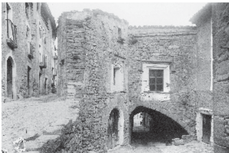
Racó de cal Minguella Guimerà.

surten els preveres i canonges, seguits dels hisendats i professions liberals, com el notari. Aquests podien tenir més d'una minyona en funció del volum de la família i de les dimensions de la casa. Unes altres cases que les demanen són germanes solteres o algun home que viu sol, solter o vidu, com és el cas d'un mariner.