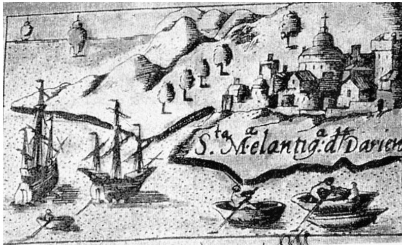
Grabado antiguo en el que se representa la ciudad de Santa María de la Antigua del Darién, primitiva capital de Castilla del Oro

En 1525 el Darién, donde se había venido desarrollando una de las experiencias de dominio más sugestiva y peor conocida del pasado colonial americano, quedó convertido en una colonia fantasma. La frontera del hambre, escenario de encuentros y experiencias nuevas, paraíso de ilusiones y vidas truncadas, se cierra definitivamente para acabar siendo engullida por el verde esmeralda de una selva que todo lo devora.