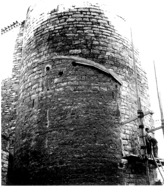
Torre de planta circular que formava part del primer tram de la muralla. Aquest torricó, situat a la cantonada de l'Avinguda Catalunya amb la Plaça del Carme, conserva part de la seva alçada original. A mitjans dels anys seixanta, època que data la fotografia, es va rebaixar bona part de la seva alçaria quan es va edificar el Banc Popular.