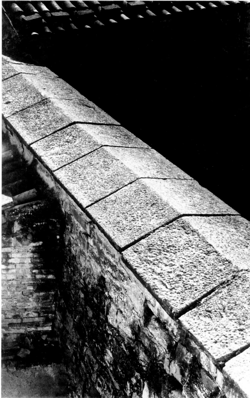
Pany de paret corresponent al tercer tram de la muralla, conservat al carrer Hospital, entre cal Vidal Pagès i el Reguer.