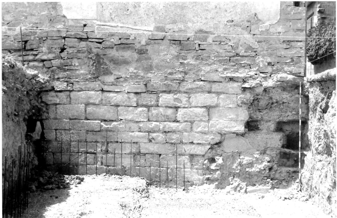
Restes d'un tram de muralla seccionada, amb una torre de planta quadrangular adossada, corresponent al quart tram de muralla. Aquest tram de muralla es trobava soterrat i va ser afectat durant les obres de construcció de la piscina del centre FISALUT, a la cantonada del carrer Migdia amb el carrer de les Sïges. Un tram de les filades inferiors de l'antiga torre es troba reaprofitat com a fonamentació d'una construcció moderna.