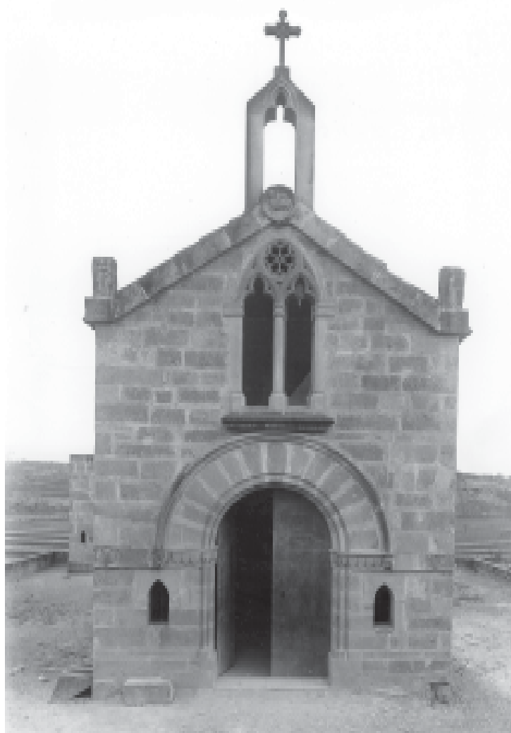
Façana de l'ermita de Santa Maria del Pedregal

Els edificis de Vallsanta foren apropiats pels senyors de la vila de Guimerà, amb cognoms d'Èvol, d'Aragó, de Castre i de Pinós. Un membre d'aquests llinatges, el 1594 arrendava els edificis monacals, amb l'obligació per part de l'arrendatari de conservar-los i respectar-ne la integritat. Aquest arrendatari conreava les terres immediates al monestir, i que hi havien pertanyut. En aquella darrereria del segle XVI, l'església es conservava bé, i sota inventari, eren confiats a la custòdia de l'arrendatari dels altars, els mobles del culte, els retaules, les robes litúrgiques i totes les altres coses que s'hi contenien. Però aquest estat de coses anà