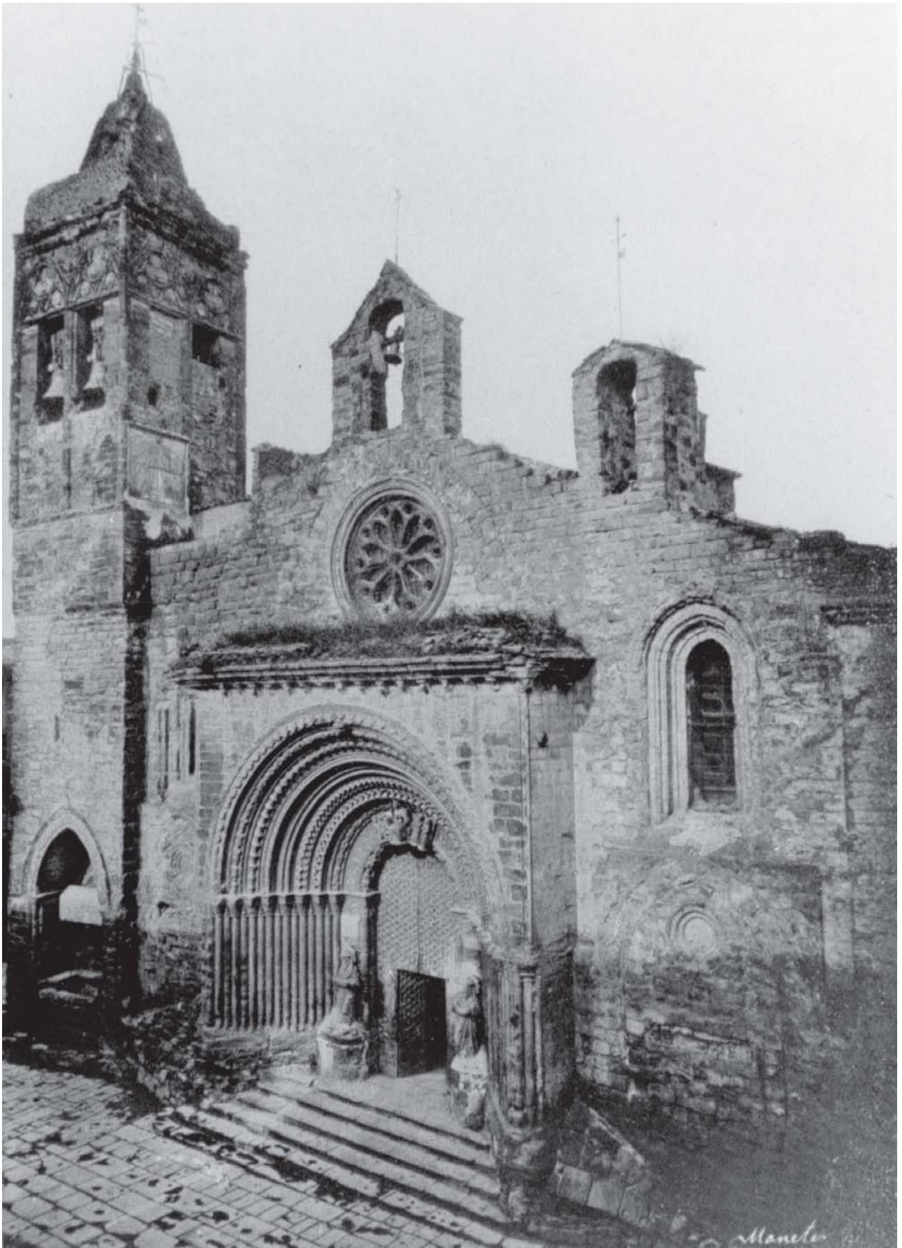
Façana del temple romànic de Santa Maria d'Agramunt, l'any 1880.

Imatge extreta del llibre de Josep Pleyan de Porta: