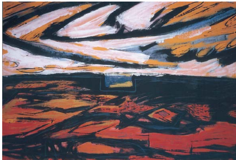
Paisatge, Oli sobre tela.

En els anys 90, busca en els diversos ombrejats l'explicació de les terres estimades de l'Urgell i la Segarra. Els turons, els marges, els camps segats, seran els protagonistes de les seves teles. Del 1992 és aquesta vista d'una de les fondalades típiques del nostre paisatge. És un quadre d'un horitzó elevat que mostra tota la profunditat que podia abraçar la mirada, al mateix temps que els tons liles dels fons, en una gradació tonal perfecta, ens van desvetllant, en diferents escalats, la configuració de tots els accidents del paisatge. En un primer terme, unes pinzellades individualitzades i pastoses, ens donen les herbes salvatges de l'estiu, mentre que una gran llengua groguenca exhibeix, a un temps, els camps segats i la potència del sol que accentua els marges i retalla, sense compassió, les ombres que delimiten el treball de l'home sobre el camp.