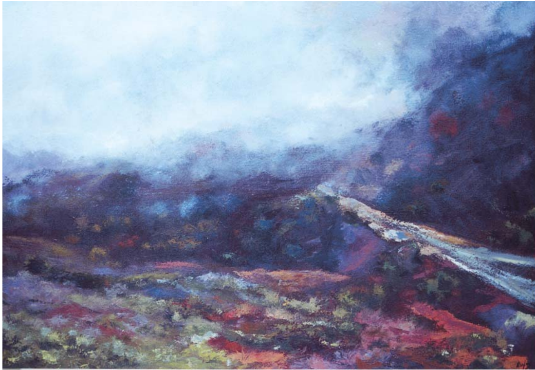
Paisatge d'hivern, Oli sobre tela.

Aquesta tela (100x81) pintada l'any 1991, podria ser, segons expressa el propi autor, el camí per on ara voldria dirigir el seu camp d'experimentació. És a dir, jugant amb els colors, vol donar unes formes indefinides, però suggerents, que ens transfereixin als espectadors un punt de reflexió, més que de percepció, de manera que haguem de buscar-hi el nostre propi paisatge, més que el panorama definit de tal o tal terme i on la brillantor d'uns tons vingui donada pel contrast dels seus complementaris i la gradació dels colors ens apuntin a un possible fons que podrem vestir segons el nostre desig o el nostre estat d'ànim.