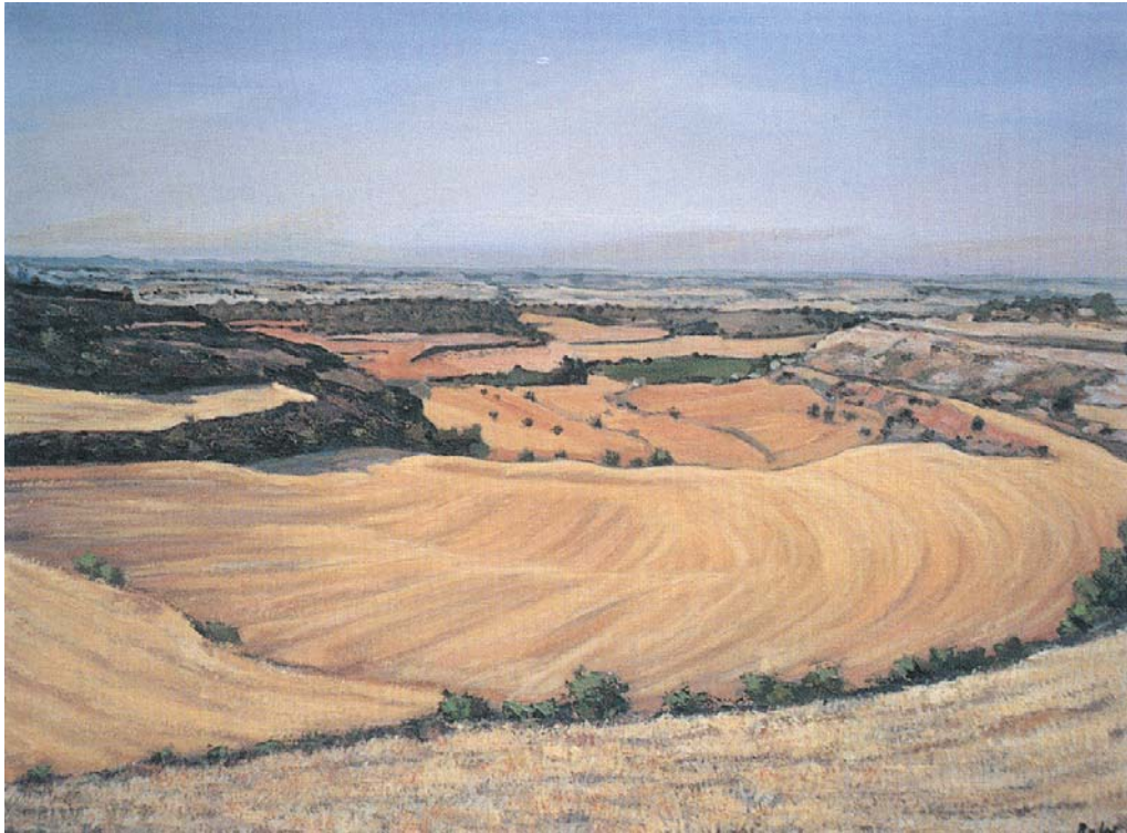
Paisatge d'estiu, Oli sobre tela.

En els anys 90, busca en els diversos ombrejats l'explicació de les terres estimades de l'Urgell i la Segarra. Els turons, els marges, els camps segats, seran els protagonistes de les seves teles. Del 1992 és aquesta vista d'una de les fondalades típiques del nostre paisatge. És un quadre d'un horitzó elevat que mostra tota la profunditat que podia abraçar la mirada, al mateix temps que els tons liles dels fons, en una gradació tonal perfecta, ens van desvetllant, en diferents escalats, la configuració de tots els accidents del paisatge. En un primer terme, unes pinzellades individualitzades i pastoses, ens donen les herbes salvatges de l'estiu, mentre que una gran llengua groguenca exhibeix, a un temps, els camps segats i la potència del sol que accentua els marges i retalla, sense compassió, les ombres que delimiten el treball de l'home sobre el camp.