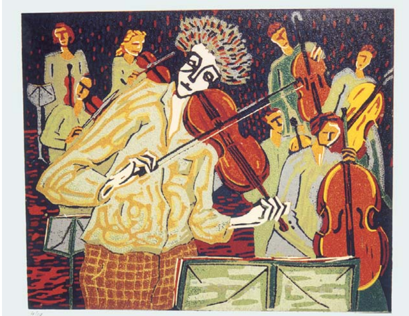
Assaig d'orquestra, linogravat.

Amb 16 tintes va gravar el 1988 aquesta panoràmica musical (25,5x20,8). En ella dóna un tractament molt diferent a la figura del protagonista i al conjunt de músics que l'envolten, ja que mentre en tots els músics del conjunt matisa el vestuari, al xicot del primer terme li dóna un ratllat enèrgic que no sembla una vestimenta diferent de la dels altres perquè totes estan acolorides en verd, sinó que és la causa de les vibracions del seu propi cos acompanyant el violí. Tot en ell es fon amb la música que interpreta: les seves mans estan finament gravades perquè treuen de l'instrument un so especialment delicat i els ulls clucs ens transmeten també, l'emoció del moment que està vivint. Les cares de la resta estan només insinuades, però podem llegir les diferents expressions en cadascuna d'elles.