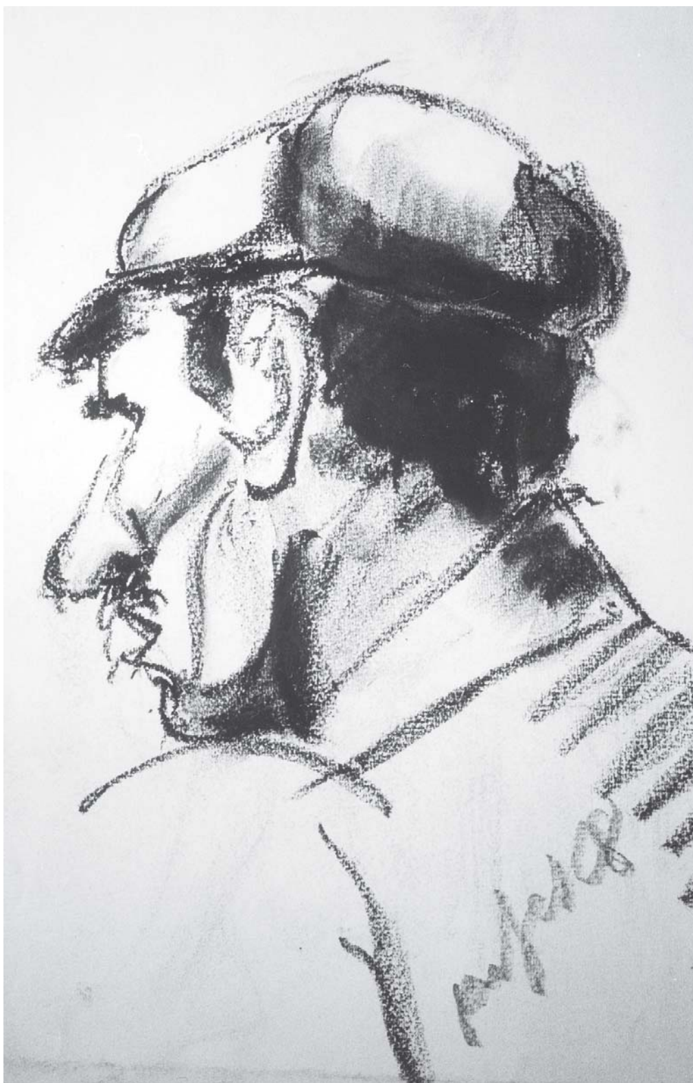
Home, Cera sobre paper.

Del 1968 és aquest apunt (36x46), que realitza amb cera sobre paper i que ens mostra, des del darrere el cap i l'espatlla d'un home. La precisió amb el traçat de les línies, que subratlla els rasgues més sobresortits, com si d'una caricatura es tractés, ens parla del domini tècnic que té en Francesc per al dibuix; però, a més, el resultat ens dóna un valor afegit: és potser un dels pocs dibuixos de la història de l'art, on es nota la intensitat de la mirada del personatge, sense haver-li dibuixat els ulls.