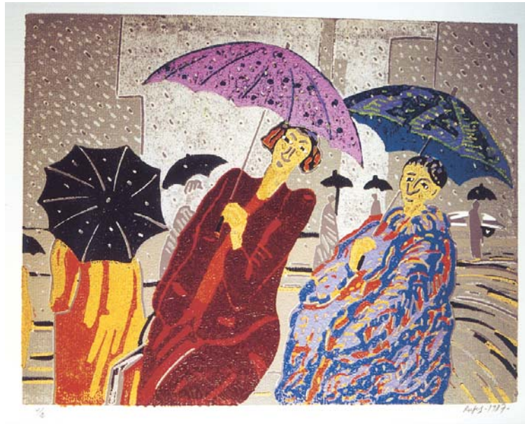
Dia plujós, linogravat.

Amb 16 tintes va gravar el 1988 aquesta panoràmica musical (25,5x20,8). En ella dóna un tractament molt diferent a la figura del protagonista i al conjunt de músics que l'envolten, ja que mentre en tots els músics del conjunt matisa el vestuari, al xicot del primer terme li dóna un ratllat enèrgic que no sembla una vestimenta diferent de la dels altres perquè totes estan acolorides en verd, sinó que és la causa de les vibracions del seu propi cos acompanyant el violí. Tot en ell es fon amb la música que interpreta: les seves mans estan finament gravades perquè treuen de l'instrument un so especialment delicat i els ulls clucs ens transmeten també, l'emoció del moment que està vivint. Les cares de la resta estan només insinuades, però podem llegir les diferents expressions en cadascuna d'elles.