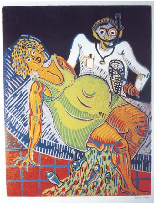
Serie Metges. Trencant Aigües, linogravat

Aquesta tela (100x81) pintada l'any 1991, podria ser, segons expressa el propi autor, el camí per on ara voldria dirigir el seu camp d'experimentació. És a dir, jugant amb els colors, vol donar unes formes indefinides, però suggerents, que ens transfereixin als espectadors un punt de reflexió, més que de percepció, de manera que haguem de buscar-hi el nostre propi paisatge, més que el panorama definit de tal o tal terme i on la brillantor d'uns tons vingui donada pel contrast dels seus complementaris i la gradació dels colors ens apuntin a un possible fons que podrem vestir segons el nostre desig o el nostre estat d'ànim.