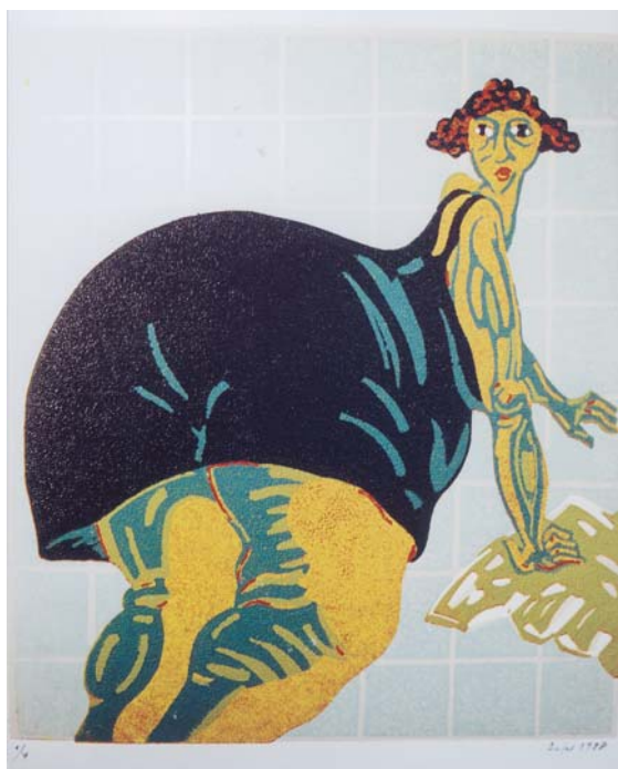
Dona fregant, linogravat.

Aquesta vista del Pati de Tàrrrega (32,5x22), gravada el 1989, està realitzada amb 15 tintes i per això podem veure-hi la presència de l'hivern que es manifesta en un cel grisós - però no uniforme de color- i en una atmosfera espessa que desdibuixa les cases del fons, que s'apunten només com una insinuant ombra, mentre que en primer terme hi brillen els verds de les plantes i els carabasses del primer banc.