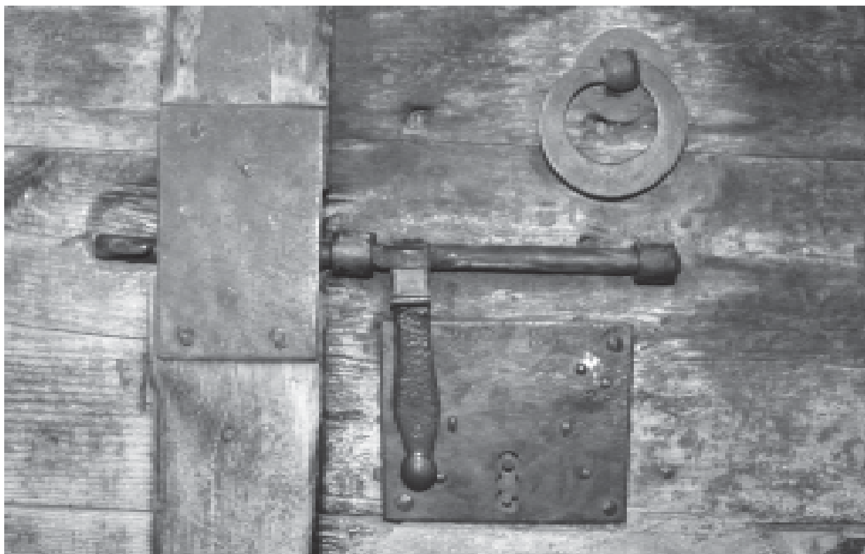
Pany i forrellat d'una quadra d'Esterri d'Àneu.

seu mobiliari a les valls d'Àneu. És per això que en aquest programa de recerca es compta amb l'assessorament universitari extern de l'equip d'autors de l'estudi sobre la vall d'Aran; al mateix temps alguns membres de l'equip aneuenc de recerca ja participaren en alguna mesura en la recerca sobre la casa aranesa. La proximitat territorial i temporal permet posar en joc tot tipus de treballs comparatius, que sens dubte aportaran nova llum sobre molts aspectes, al mateix temps la perspectiva i metodologia proposades són perfectament útils encara avui, tot i que en el present programa de recerca es pro-