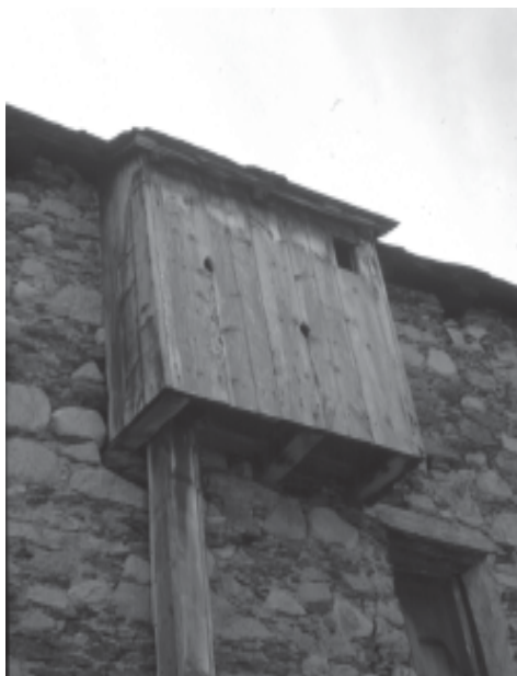
Comuna afegida en una casa d'Àreu, poble avui deshabitat.

En aquest àmbit gairebé tot està per fer i només es poden trobar algunes referències dins alguns dels darrers estudis sobre arquitectura popular pirinenca, com és el cas del llibre de Rábanos sobre l'alt Aragó i de Roigé, Estrada i Beltran sobre la vall d'Aran. Sens dubte la