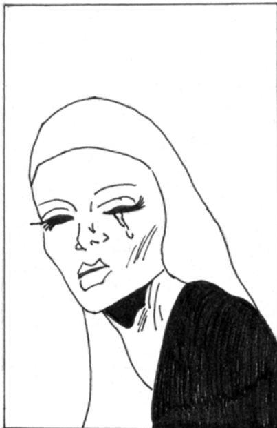
... Y A DOÑA JIMENA EL REY LUEGO EN ORDEN LA PONÍA ...