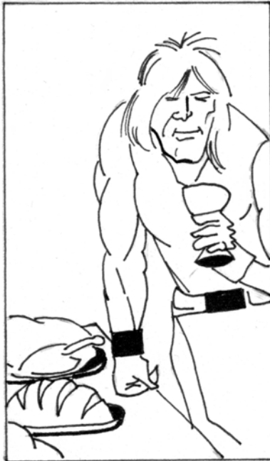
... EN LA CORTE DEL CASTO ALFONSO, BERNARDO A PLACER VIVÍA ...