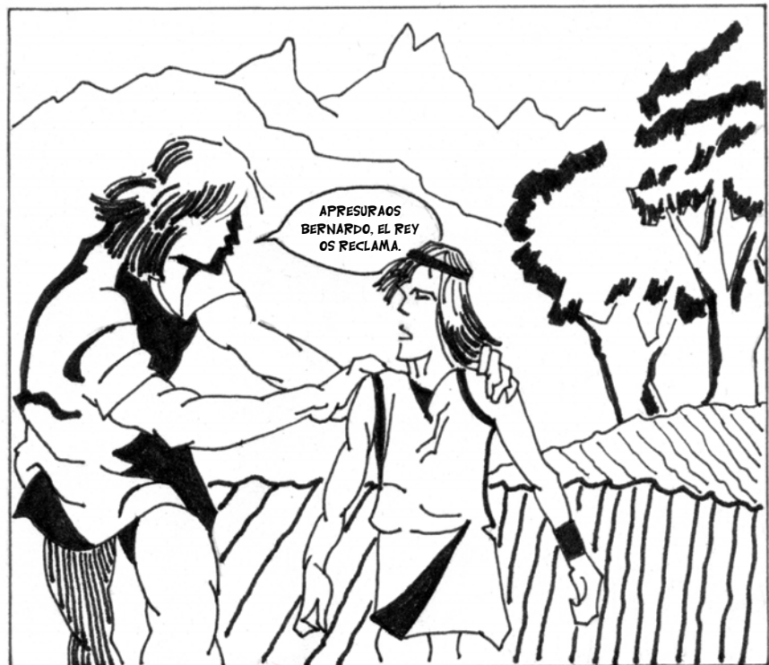
... EL REY POR BERNARDO ENVÍA ...