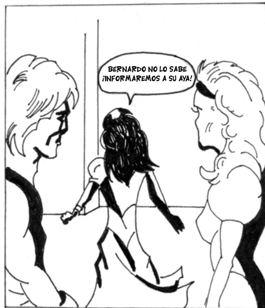
... DE LA PRISIÓN DE SU PADRE, CON ESTAS DUEÑAS HABLARON ...