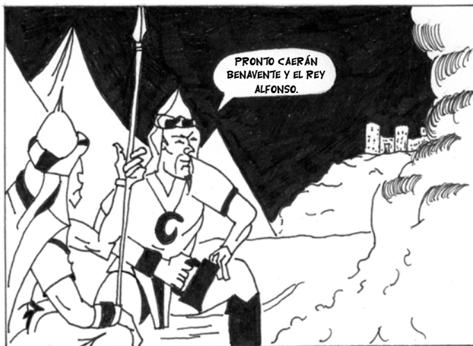
... MAS LOS MOROS QUE ERAN MUCHOS, AL REY TENÍAN CERCADO ...