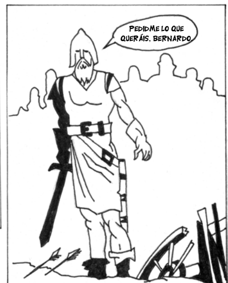
... ENTONCES LE DIJO EL REY, QUE LE DEMANDASE ALGO ...