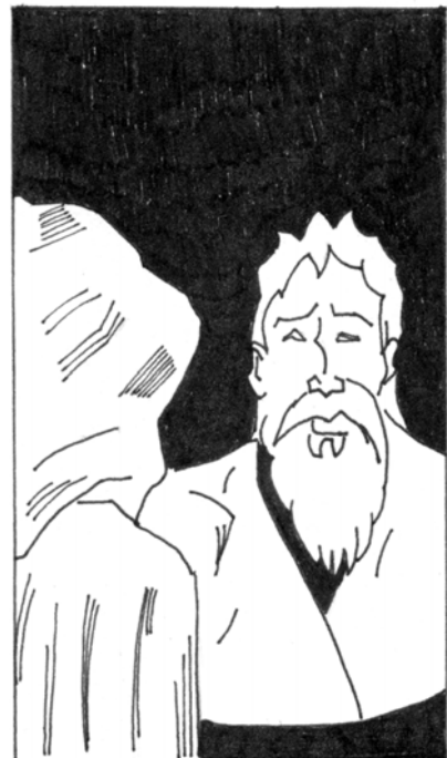
... VISTIÓSE PAÑOS DE LUTO, Y DELANTE EL REY SE IBA ...