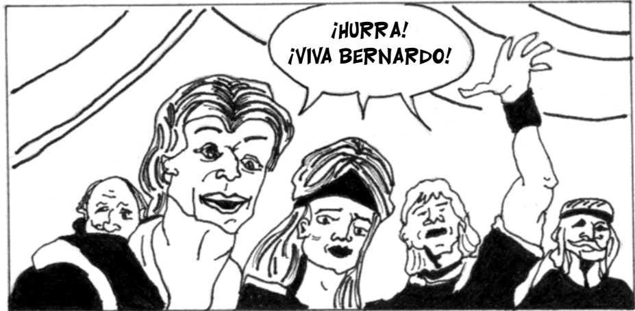
... TODOS LOS HOMBRES DEL MUNDO LE ACATABAN CORTESÍA ...