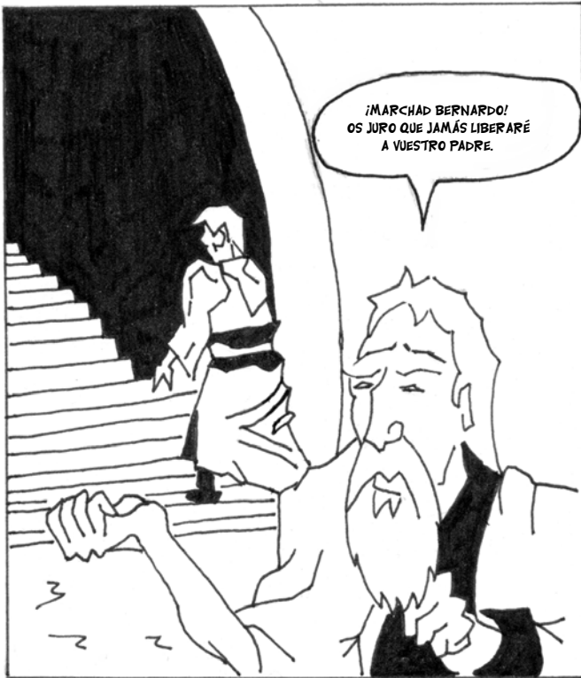
... PARTÍOS DE MÍ Y NO TENGÁIS OSADÍA ...