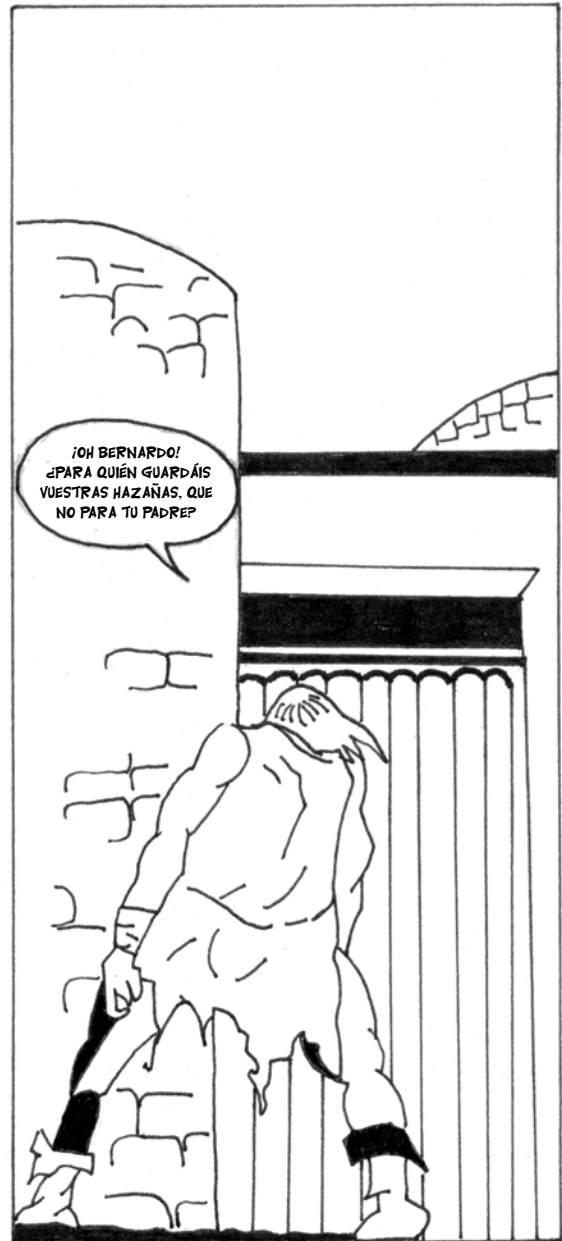
... AQUÍ ESTOY EN ESTOS HIERROS, Y PUES D'ELLOS NO ME SACAS ...