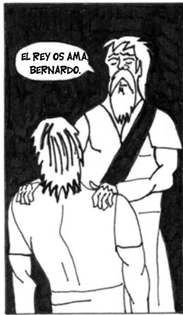
... COMO SI FUERA SU HIJO, PORQUE NINGUNO TENÍA ...