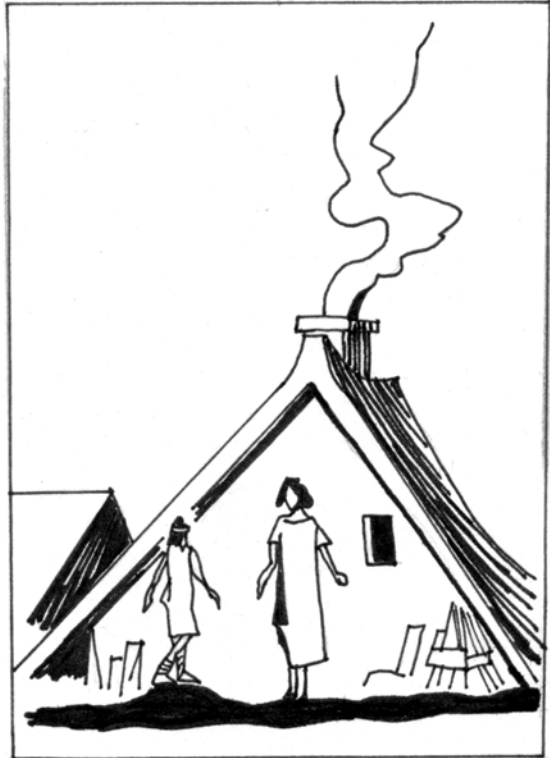
... MANDÉIS CRIAR A BERNARDO, QUE EN LAS ESTURIAS YACÍA ...