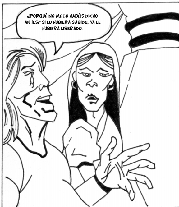
... AL CIELO VUELVE LOS OJOS, Y EN MIL LÁGRIMAS BAÑADO ...