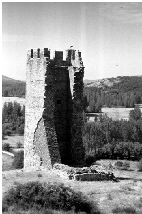
Vista del torreón, testigo impasible del territorio que dominaron los Tapia.

Por su parte, Gonzalo de Tapia , el mayor de los hermanos, fue un gran soldado y gentil hombre de Carlos V, según consta en una cédula fechada en Granada el 9 de septiembre de 1526, inscrita