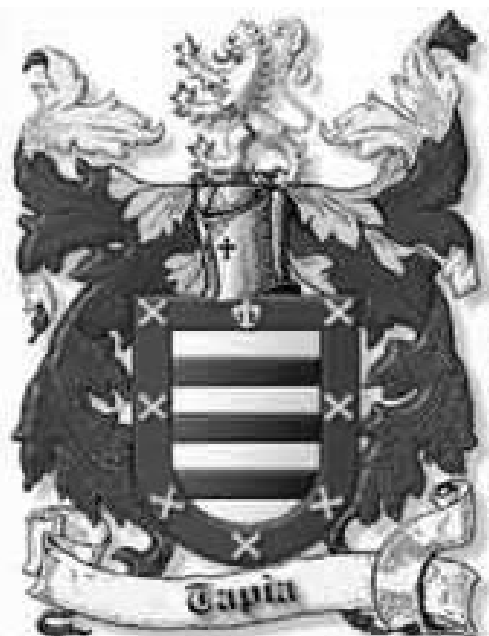
Escudo de la familia Tapia. En campo de plata, tres fajas de azul. Bordura de gules con siete aspas o sotueres de oro y una lis de plata en jefe.