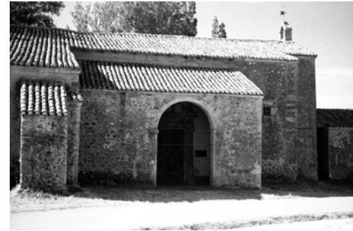
Fachada de la ermita de Camposagrado.

A pesar de todos los intentos por impedir que el enemigo llegara hasta el último bastión de tierra cristiana, lo cierto es que los árabes consiguieron llegar hasta Gijón siendo Munuza 4 su gobernador. Este hecho obligó a Pelayo a mantener constantes escaramuzas contra los musulmanes, los cuales usaban en sus retiradas rápidas el Puerto de la Mesa 5 . Pues bien, en este contexto y según cuenta la leyenda, será en una de estas cabalgadas a través del puerto de la Mesa cuando se libre una gran batalla entre las tropas cristianas y las árabes en el lugar que hoy conocemos como Camposagrado. Ésta fue de tal magnitud que se la bautizó como la Covadonga leonesa 6 , allá por el año 722, tras haberse librado la famosa batalla de Covadonga en tierras asturianas. El enfrentamiento entre los dos ejércitos era inminente en el lugar que se conoce como la Llana de Benlerra. El cristiano iba encabezado por don Pelayo, y el musulmán estaba liderado por Almanzor. Pero en medio de los preparativos para la cruel batalla cayó la noche. Don Pelayo, que se había retirado a un lugar apartado para orar y pedir una nueva victoria para las armas cristianas, tuvo una pronta respuesta. En medio de sus plegarias tuvo una revelación del Apóstol Santiago 7 , el cual tras apaciguar su des-