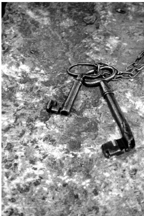
Las llaves que guardan la ermita de Camposagrado y su historia.