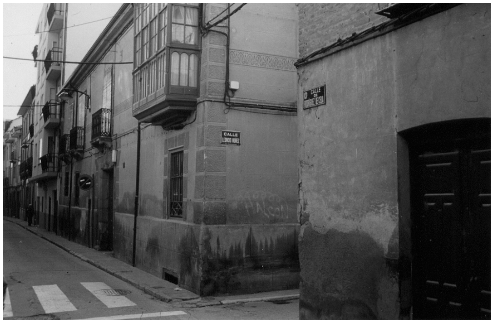
Casa solariega de los Rodríguez de Cela ( casa de Don Rodrigo ), en Astorga. En ella pasó un verano de los años 40 el poeta Gerardo Diego.

Yo le voy explicando todo lo que en Astorga de él se habló aquel día 16 de agosto de 1986: de cómo Gerardo con su familia había vivido dos veranos en Astorga – en la década de los 40-; de cómo se adentró