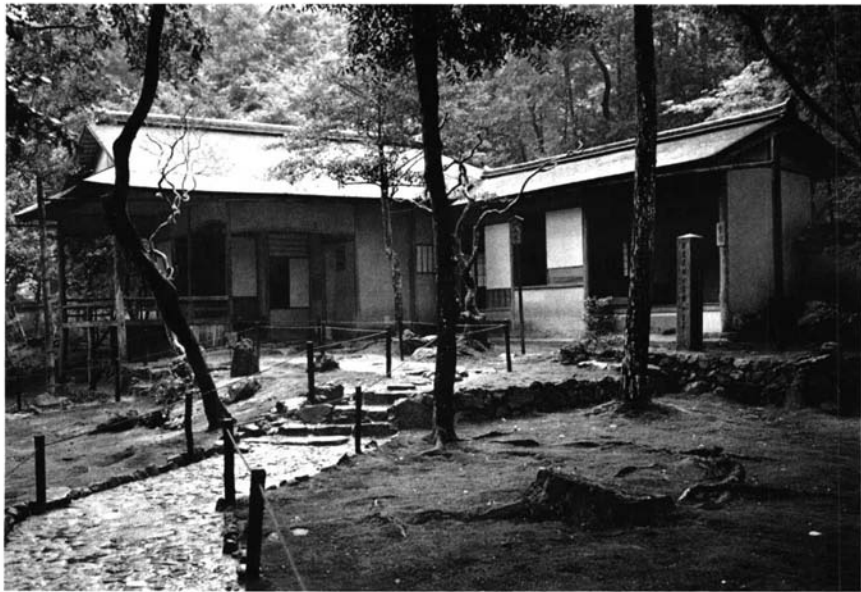
Casa de té en el jardín del templo budista Koke-dera (Kyoto, siglo XV)