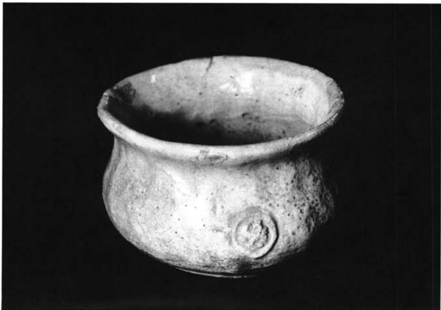
Cerámica del té: chawan del estilo Raku-yaki (siglo XVIII)