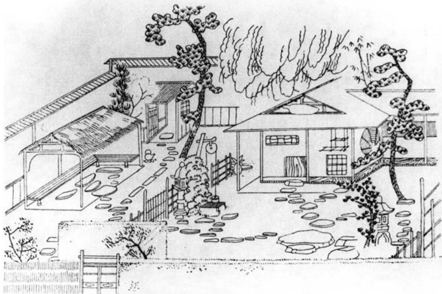
Dibujo con la descripción de todo el conjunto: lugar de espera para la ceremonia, jardín y Casa de té.