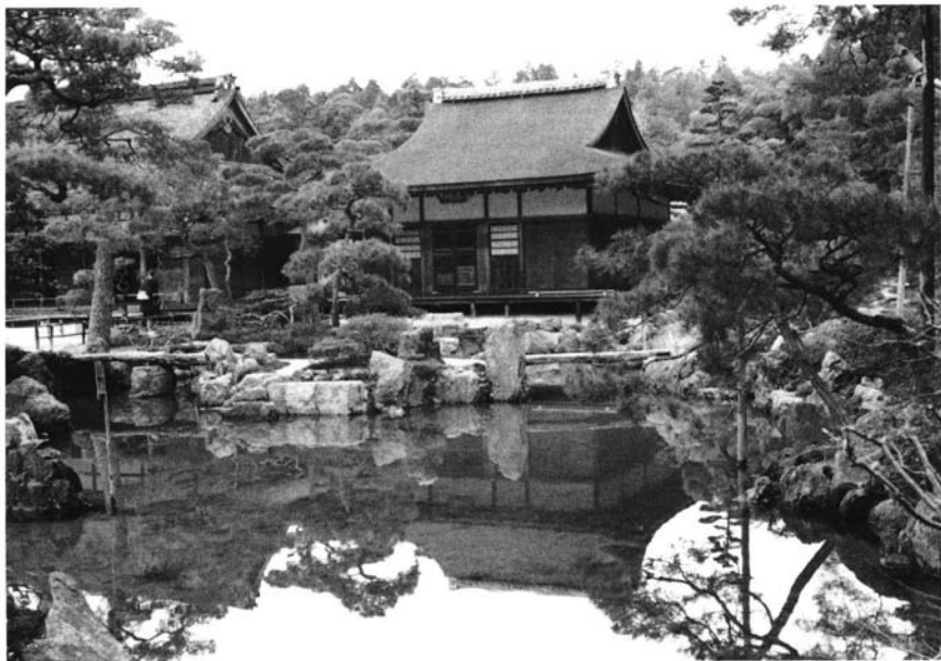
Casa de té en el jardín del templo budista Nanzen-ji (Kyoto, siglo XVII).