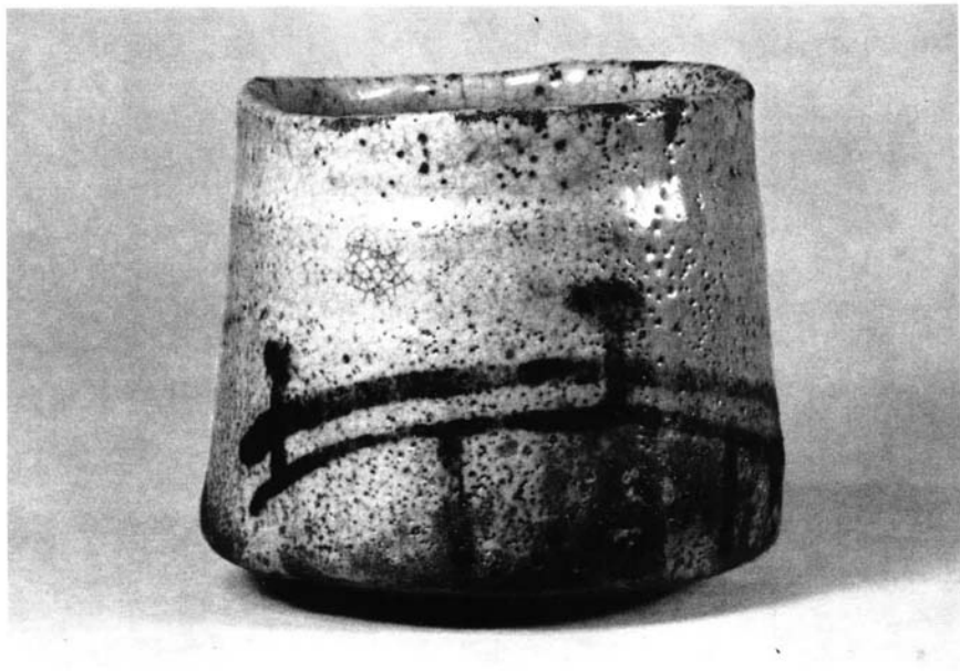
Cerámica del té: chawan del estilo Shino-yaki (siglo XVII)