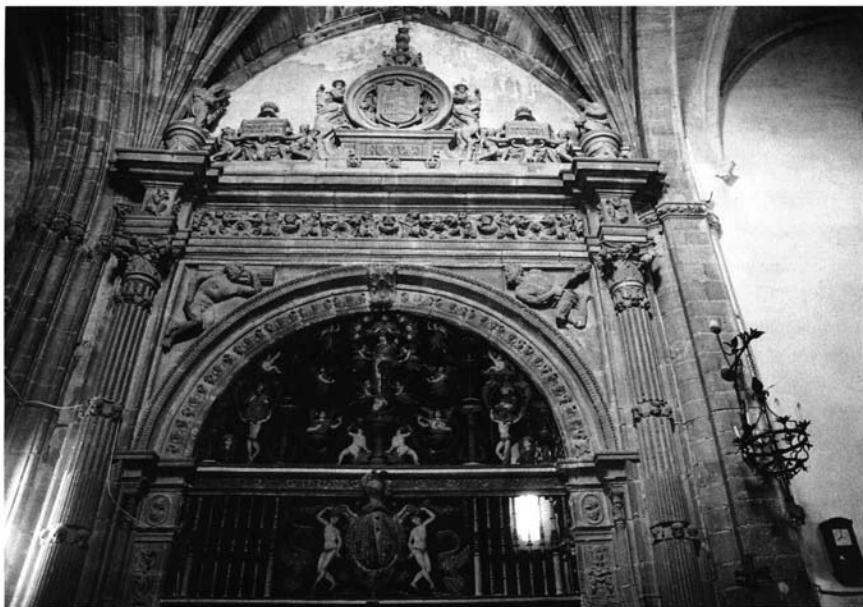
Fig. 3. Capilla funeraria del Deán Ortega, parroquia de San Nicolás, Úbeda. Representa el paso de la alegoría a la mitología en La Loma durante el Renacimiento.