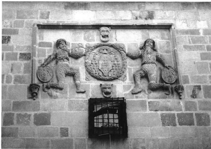
Fig. 1. Portada de la Casa de los Salvajes, Úbeda . Su iconografía y epigrafía constituyen un discurso moral y escatológico.