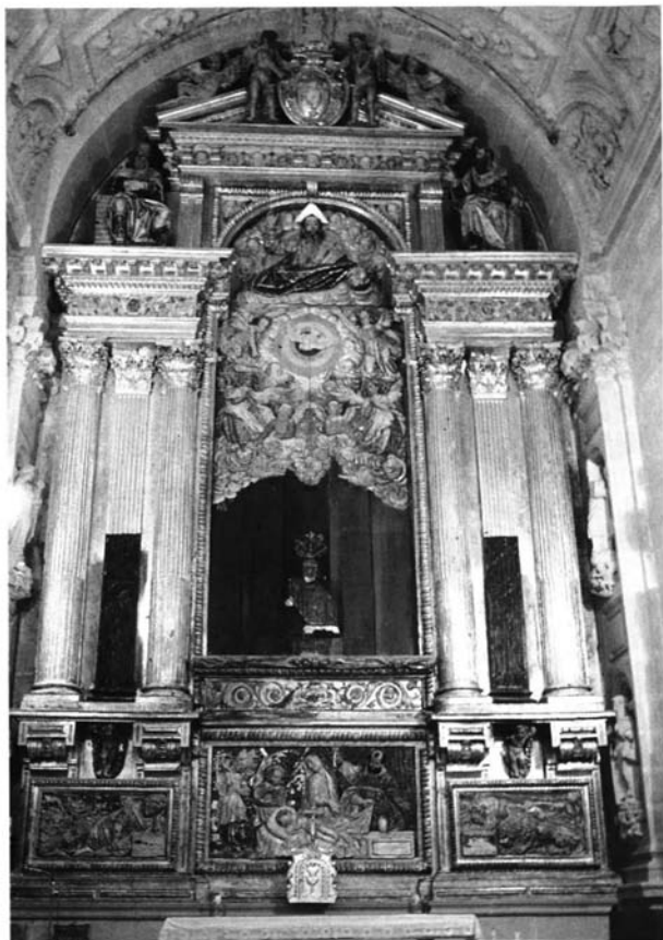
Fig. 4. Retablo de la Capilla Dorada . Está concebido como un auto sobre la Salvación por medio de la Biblia y la literatura piadosa.