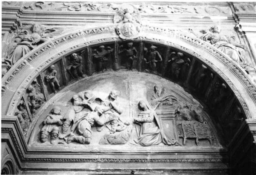
Fig. 6. Capilla Dorada, enterramiento del lado de la epístola . El intradós del arco escenifica la Rueda del Tiempo por medio de las siete edades de la vida.