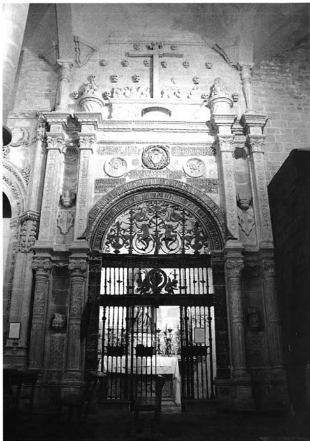
Fig. 2. Capilla funeraria del Camarero Vago, parroquia de San Pablo, Úbeda. Desarrolla el contenido simbólico enunciado en la portada de la Casa de los Salvajes.