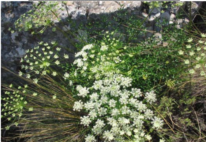
Fig. 1.- Laserpitium gallicum subsp. gallicum : Sierra de Aitana, Benifato, pr. Font de Partagat, Alicante