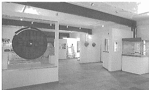
Sala Segunda: El poblado ibérico del Cerro de la Cruz.