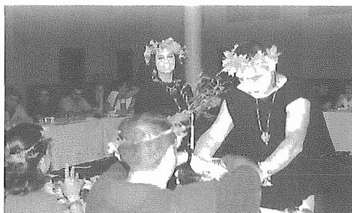
Actividades de dinamización: Los Placeres de la Mesa Romana.