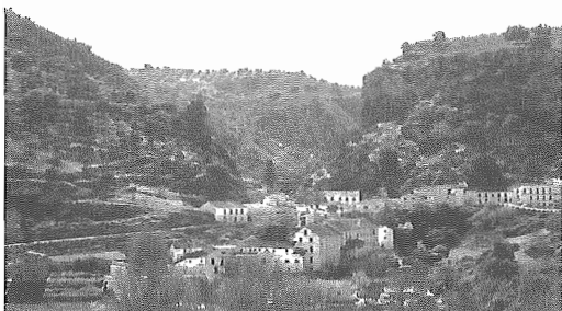
Panorámica de Almedinilla.