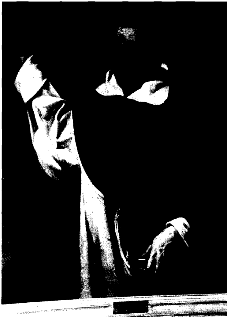
Figura 2. San Vicente Ferrer procedente del Ayuntamiento de Valencia. J. J. Espinosa.

Todo lo expuesto no termina de aclarar, sin embargo, la presencia de tal pieza en el convento de religiosas. Pero la existencia en Orihuela de otro cenobio de la misma orden de mucha mayor importancia en el Colegio y Convento de Padres Dominicos de Santo Domingo con rango de Universidad, donde había una amplísima colección pictórica cuya pieza fundamental era «La Tentación de Santo Tomás» de Velázquez, aún hoy en el Museo Diocesano de la ciudad, podría llevar asimismo a pensar en una procedencia del cuadro del Colegio Sto. Domingo. Por ello también cabría suponer que nuestro lienzo de San Vicente tras la exclaustración de los dominicos perteneciese a aquel y que fuese llevado, como tantos otros objetos de valor de los que tenemos constancia, al convento tan próximo de Sta. Lucía de sus hermanas de religión, incendiado en la guerra. Es sabida la fama de Espinosa entre los