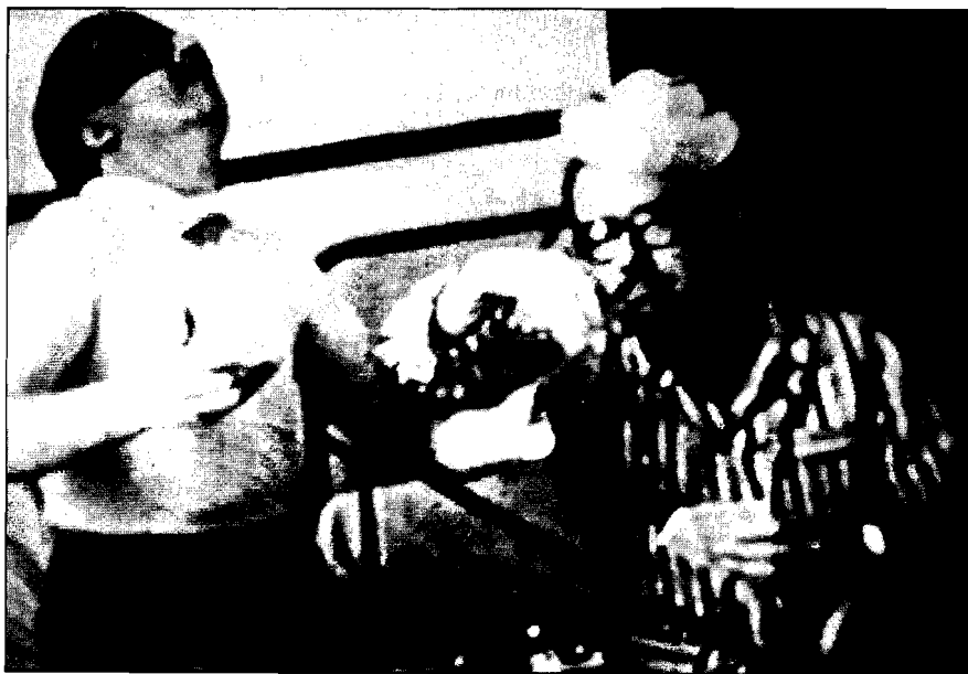
Figura 1. «Canuto, ladrón astuto» (1952), de Julián Oñate

rimentalista y vanguardista» 9 . Bajo este prisma, el cine amateur no sería sustancialmente distinto al profesional salvo en su escasez de medios y en la no competencia de sus realizadores. En esto diverge de la autoconciencia amateur plasmada en el título Otro cine 10 y en otros muchos textos.