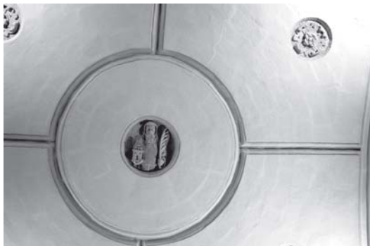
Jerez de la Frontera. Iglesia de la Victoria. Sacristía