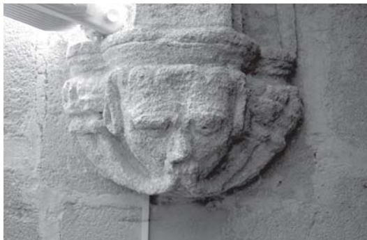
Jerez de la Frontera. Iglesia de la Victoria y la Sacristía. Mensula