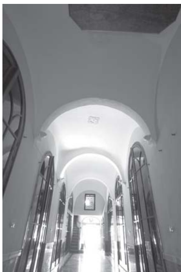
Jerez de la Frontera. Iglesia de la Victoria. Nave lateral