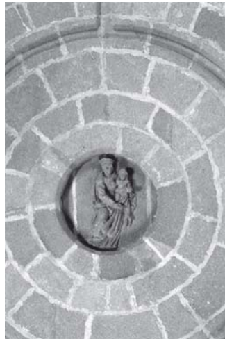
Jerez de la Frontera. Escuela de Artes y Diseño. Salón de actos. Antiguo refectorio del convento de la Victoria. Fornemenor de la bóveda