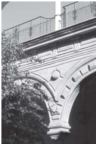
Jerez de la Frontera. Escuela de Artes y Diseño. Patio. Antiguo claustro del convento de la Victoria. Detalle