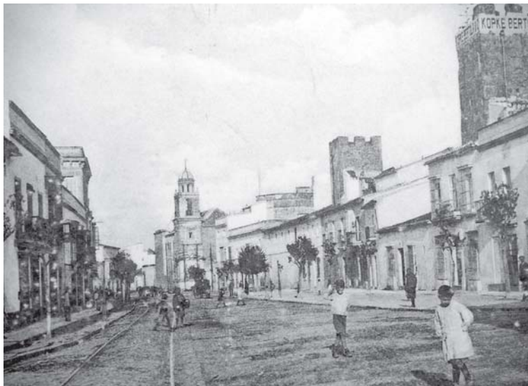
Hacia 1910. Anónimo. Fotografía de la calle ancha de Jerez. Al fondo puede apreciarse la iglesia de la Victoria antes de la demolición de la cabecera