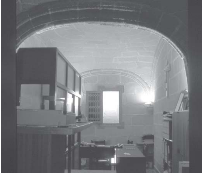
Jerez de la Frontera. Iglesia de la Victoria. Tránsito entre la iglesia y la eucaristía