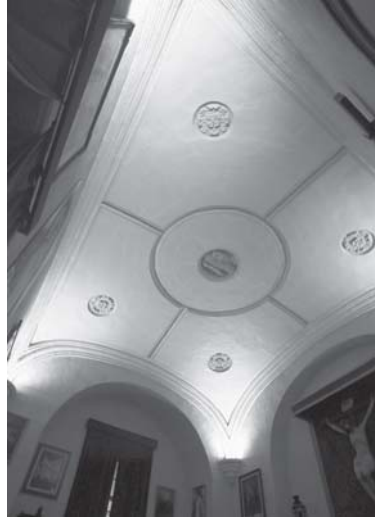
Jerez de la Frontera. Iglesia de la Victoria. Sacristía