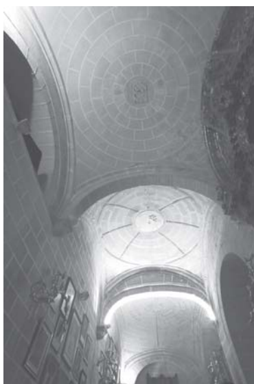
Jerez de la Frontera. Iglesia de la Victoria. Nave lateral. Bóvedas