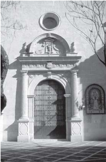
Jerez de la Frontera. Iglesia de la Victoria. Portada

En los setenta años que hemos analizado prácticamente quedó construido todo el convento. Fuera de este periodo tan sólo son destacables la reforma de la iglesia y la construcción de la torre, obras ambas de mediados del XVII que excluimos de esta comunicación por que ya han sido muy bien estudiadas por Esperanza de los Ríos, a cuya tesis remitimos al lector 66 .