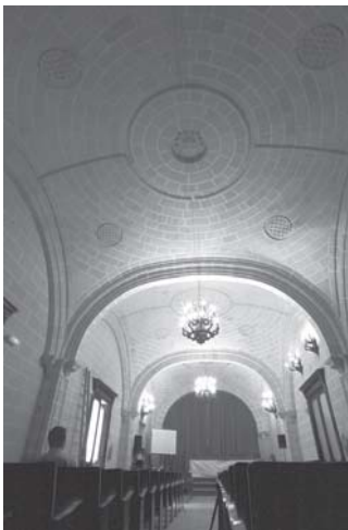
Jerez de la Frontera. Escuela de Artes y Diseño. Salón de actos. Antiguo refectorio del convento de la Victoria