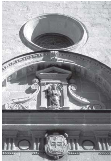
Jerez de la Frontera. Iglesia de la Victoria. Portada detalle