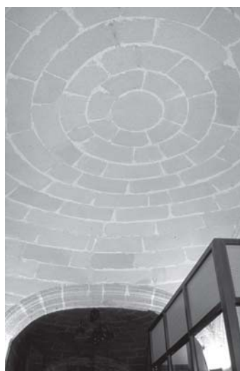
Jerez de la Frontera. Iglesia de la Victoria. Tránsito entre la iglesia y la sacristía. Detalle de la bóveda