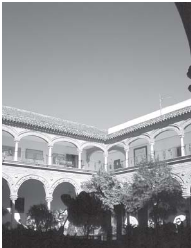
Jerez de la Frontera. Escuela de Artes y Diseño. Patio. Antiguo claustro del convento de la Victoria