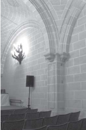
Jerez de la Frontera. Escuela de Artes y Diseño. Salón de actos. Antiguo defectorio del convento de la Victoria. Pilastra