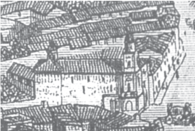
Hacia 1830. Alfred Guesdon. L'Espagne a Vol D'Oiseau. Vista de Jerez de la Frontera. Detalle en que se puede apreciar la iglesia de la Victoria