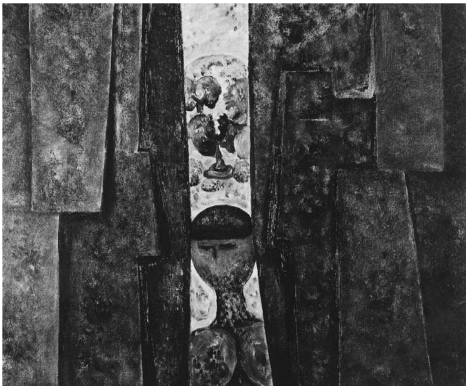
FIG. 1. J. Narbón. Autóctono . 1974. Óleo sobre lienzo. 65 x 81 cm.