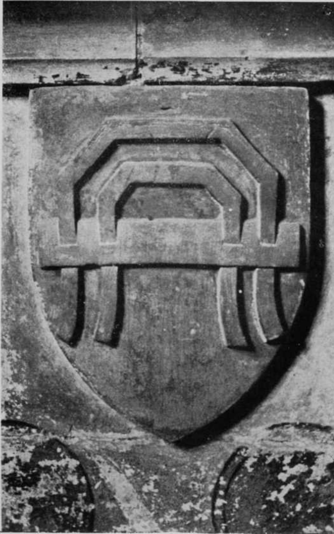
Escudo de la Casa de Veraiz