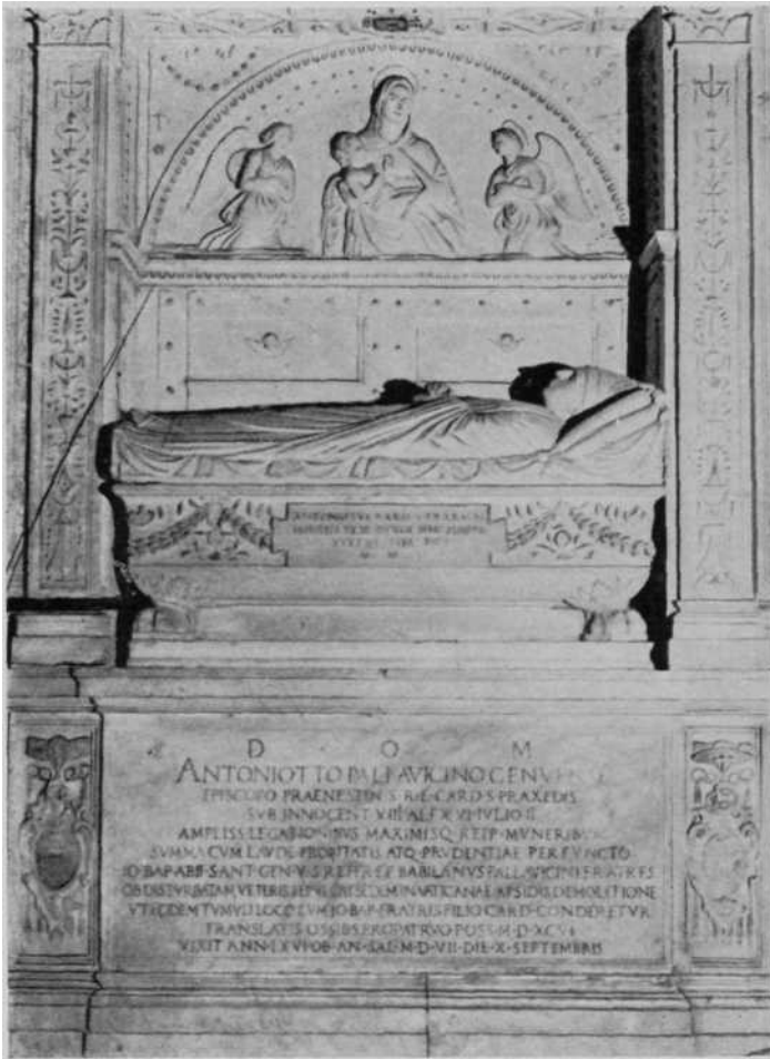
Sepulcro del Cardenal - Obispo de Pamplona Antoniotto Pallavicini en Santa María del Popolo en Roma.