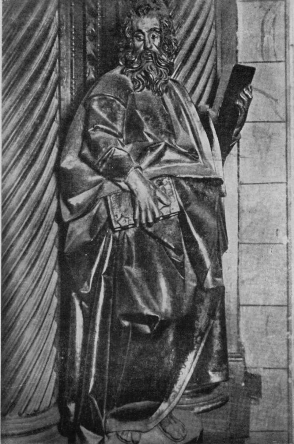
Un apóstol de Bazcardo en el Retablo Mayor de Hernani. Véanse los tiosos pliegues del ropaje