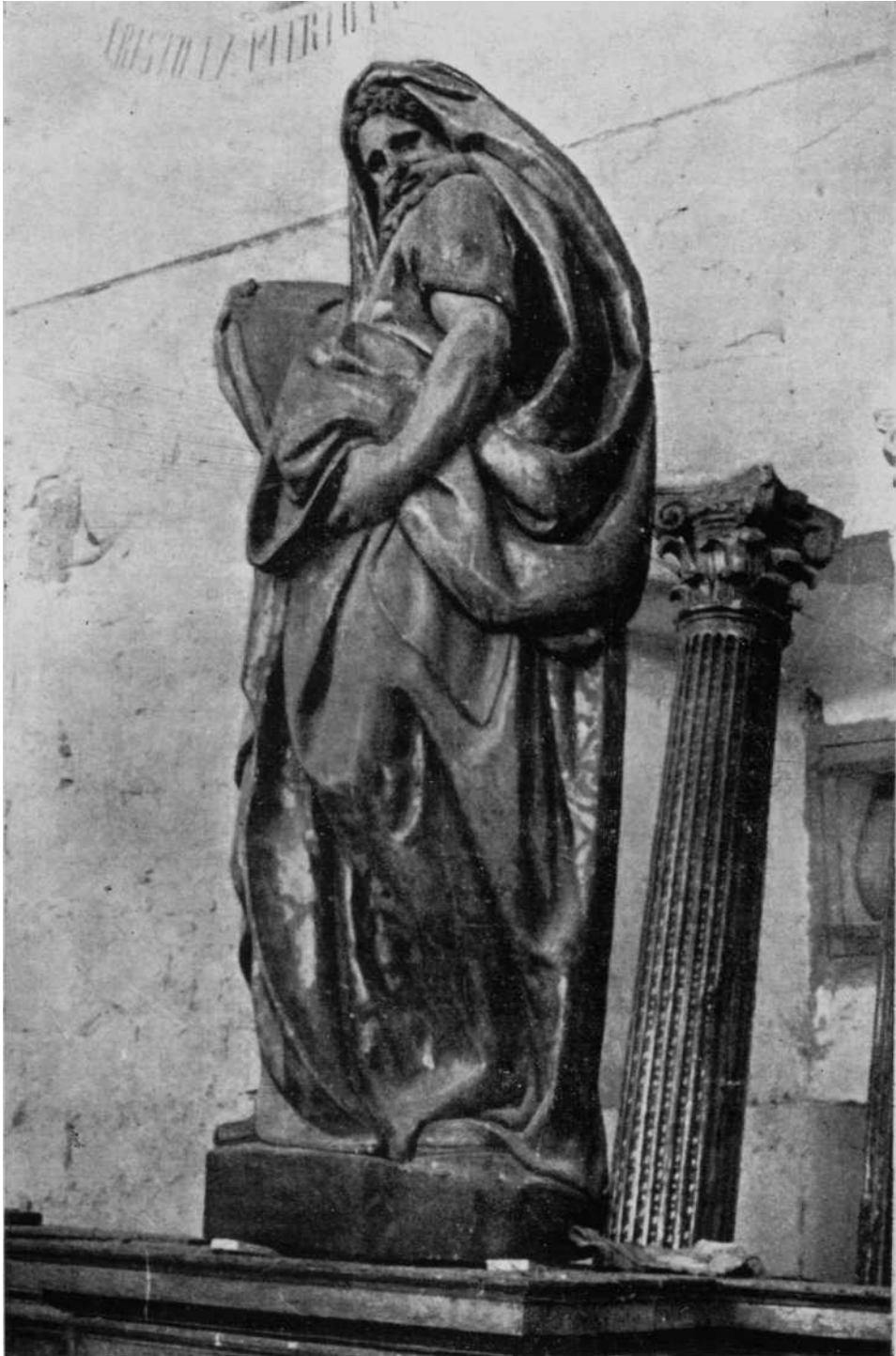
Un Miguelangelesco Moisés de Pedro González de San Pedro en el Retablo Mayor de la Catedral de Pamplona. Véase la flexibilidad mayor de los pliegues en las obras del maestro en comparación con el discípulo