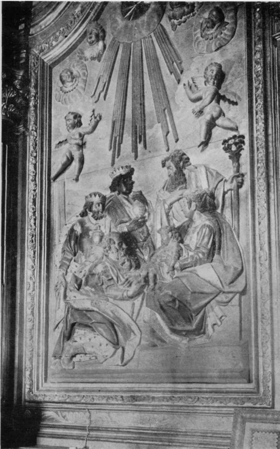
El relieve de la Adoración de los Reyes. La mitad superior es añadida en el siglo XVIII. (Calahorra).