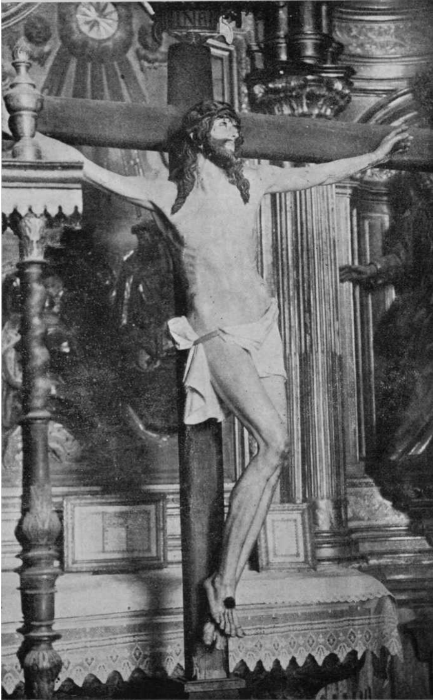
El Cristo de la Capilla de los Reyes. Año de 1628. (Calahorra).