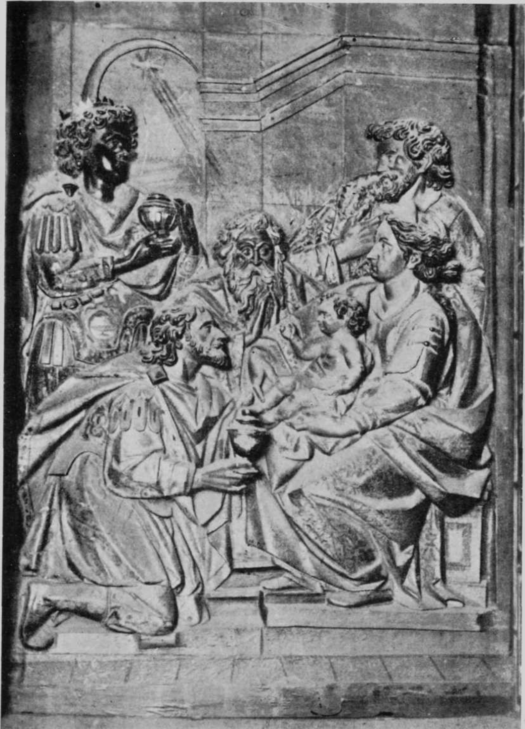
Adoración de los reyes de Fuenmayor. Véase el continente de piedad del Rey arrodillado, en contraste con la mayor fuerza del correspondiente del relieve calahorrano