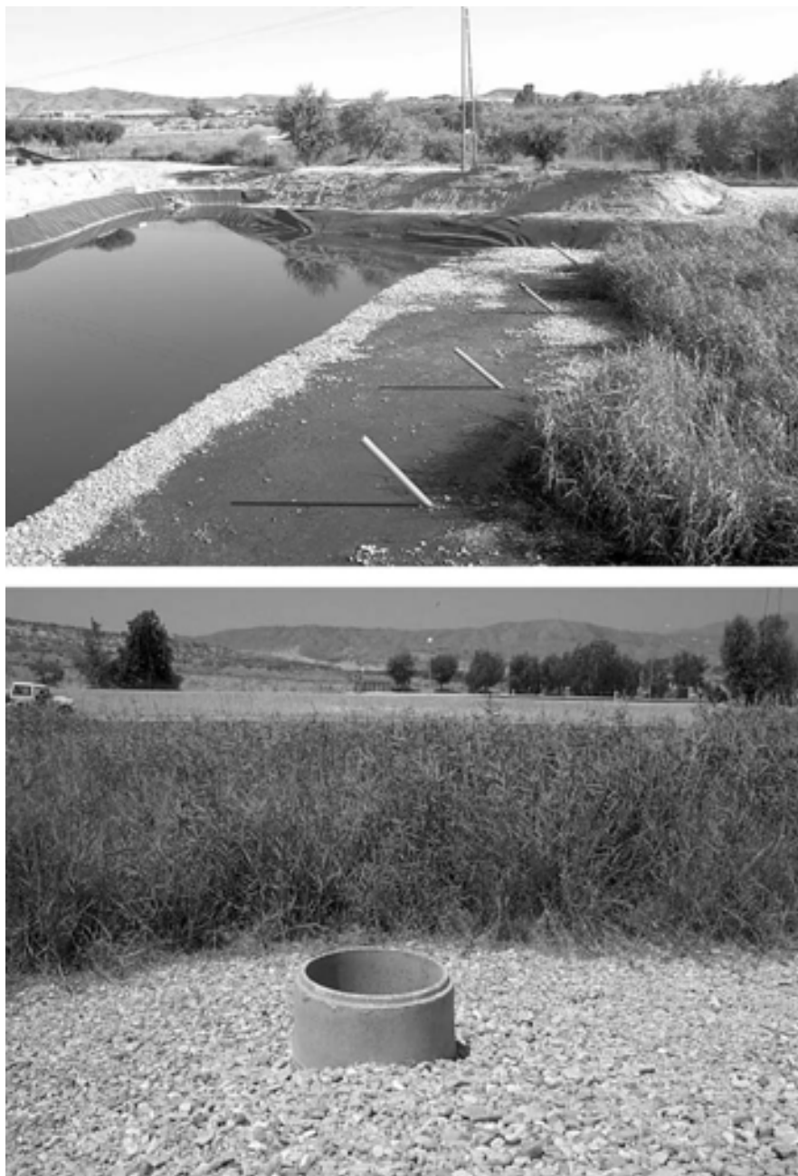
FIG. 5.- Entrada (arriba) y salida del agua (abajo) en el humedal de flujo subsuperficial de Los Gallardos (Almería).