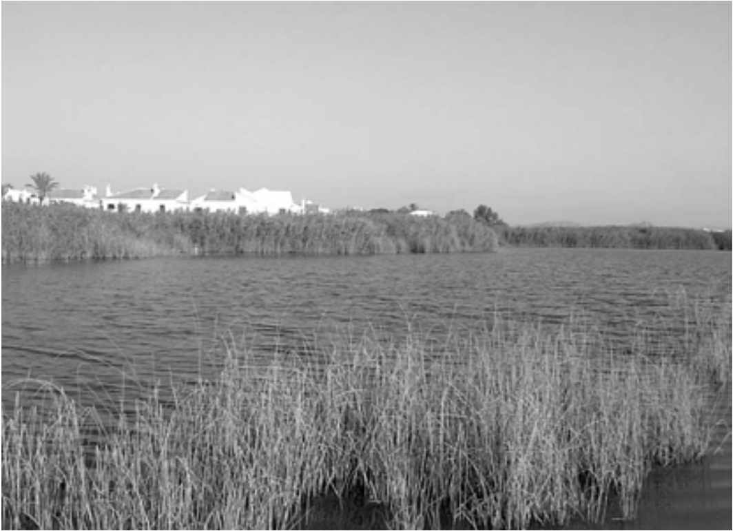
FIG. 1.- Humedal natural en la desembocadura del Río Antas (Almería).

micrófitos (generalmente microalgas), y por tanto los lagunajes no suelen ser considerados como humedales.