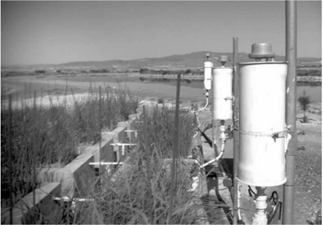
FIG. 4.- Planta experimental de GALASA.

Observados los favorables resultados obtenidos en el humedal artificial, se decidió construir un humedal a escala 1:1 en la EDAR de Los Gallardos, municipio de Almería con una población de 1.200 habitantes. La Tabla 2 recoge los datos de habitantes y caudales.