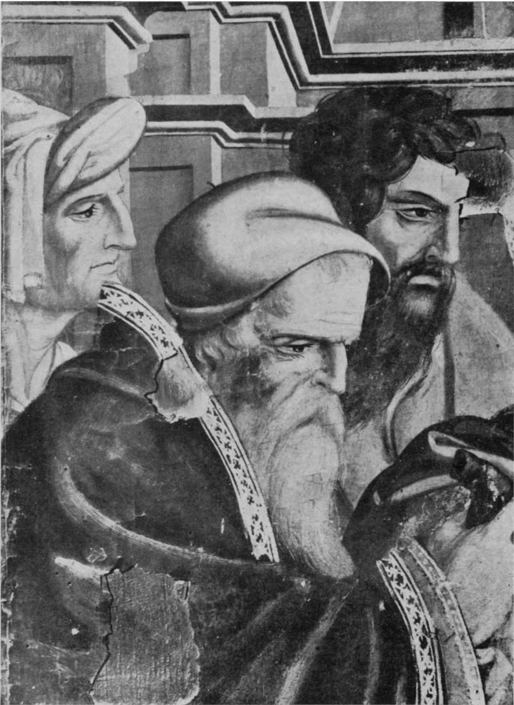
Detalle de «La Presentación de Jesús», del retablo del altar mayor de la Parroquia de Huarte (Pamplona)