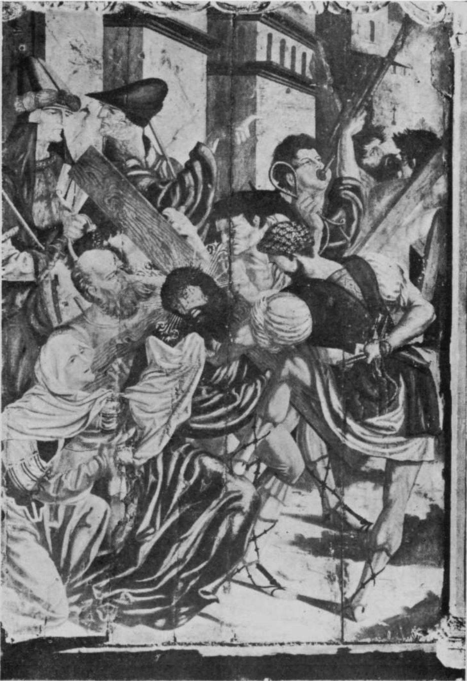
Camino del Calvario, pintura del retablo del altar mayor de la iglesia parroquial de Huarte (Pamplona)