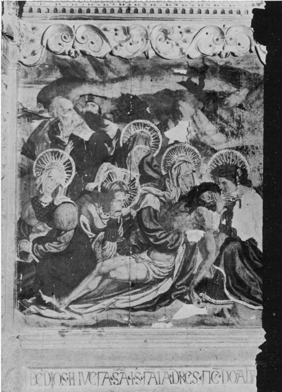
«La Piedad», pintura del retablo del altar mayor en la Iglesia parroquial de San Andrés, de Cizur Mayor