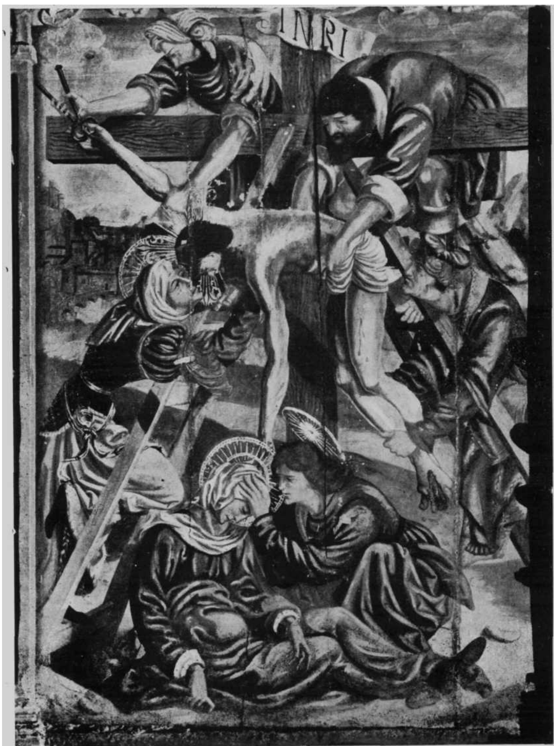
«El Descendimiento, del retablo del altar mayor de la Parroquia de, Huarte (Pamplona)