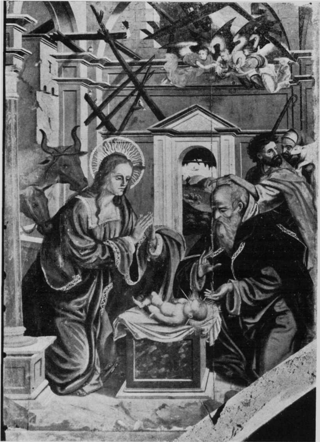
<<El Nacimiento de Jesús>>, pintura del retablo del altar mayor de la Parroquia de Huarte (Pamplona)