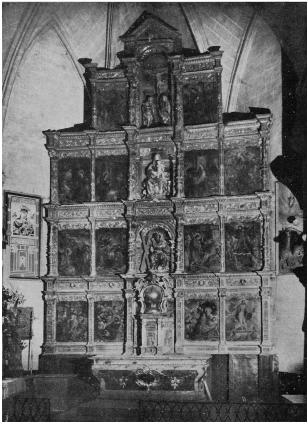
Retablo del altar mayor de la Parroquia de Cizur Mayor, antes de ser restaurado