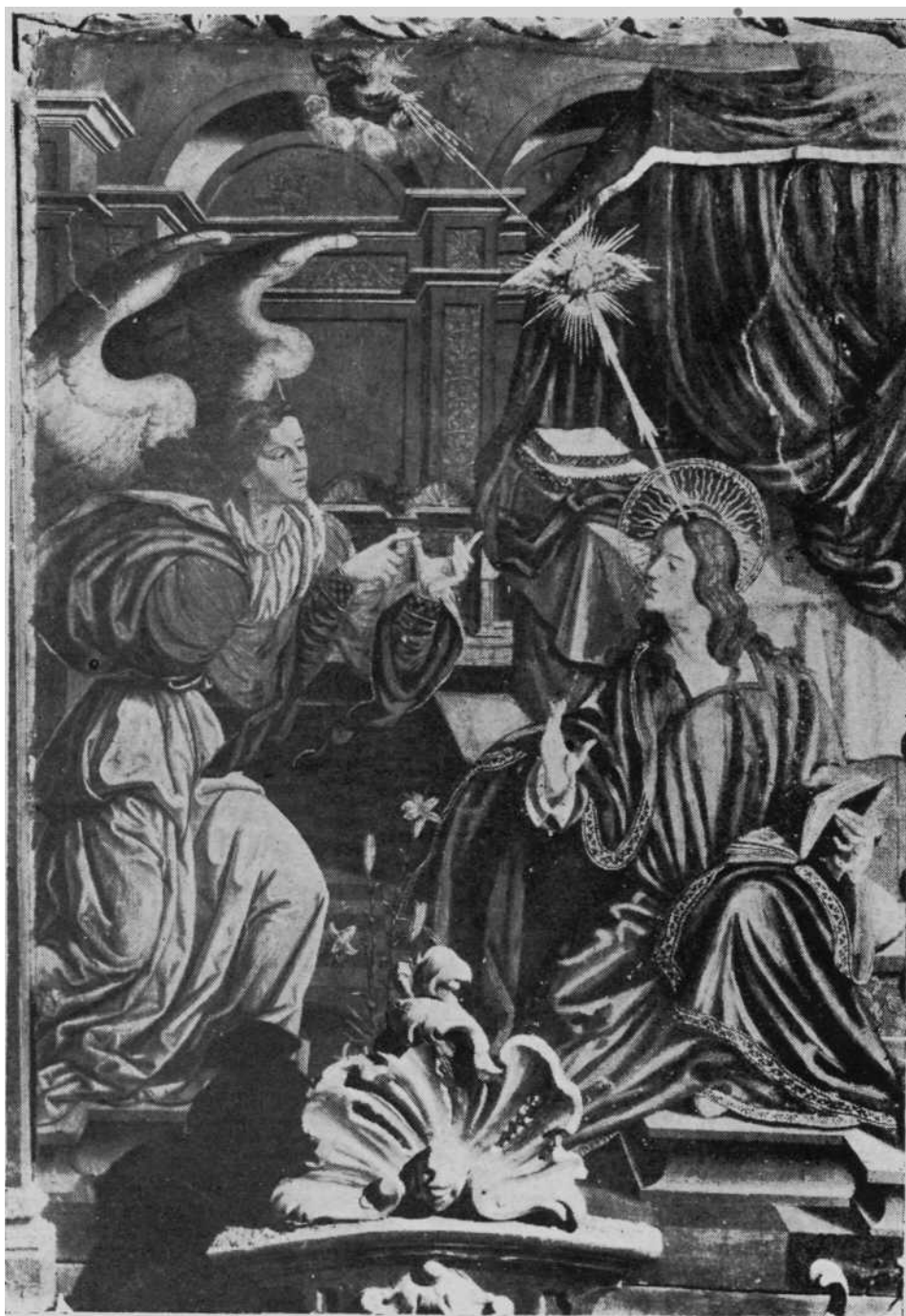
«La Anunciación», pintura del retablo del altar mayor de la iglesia parroquial de Huarte (Pamplona)