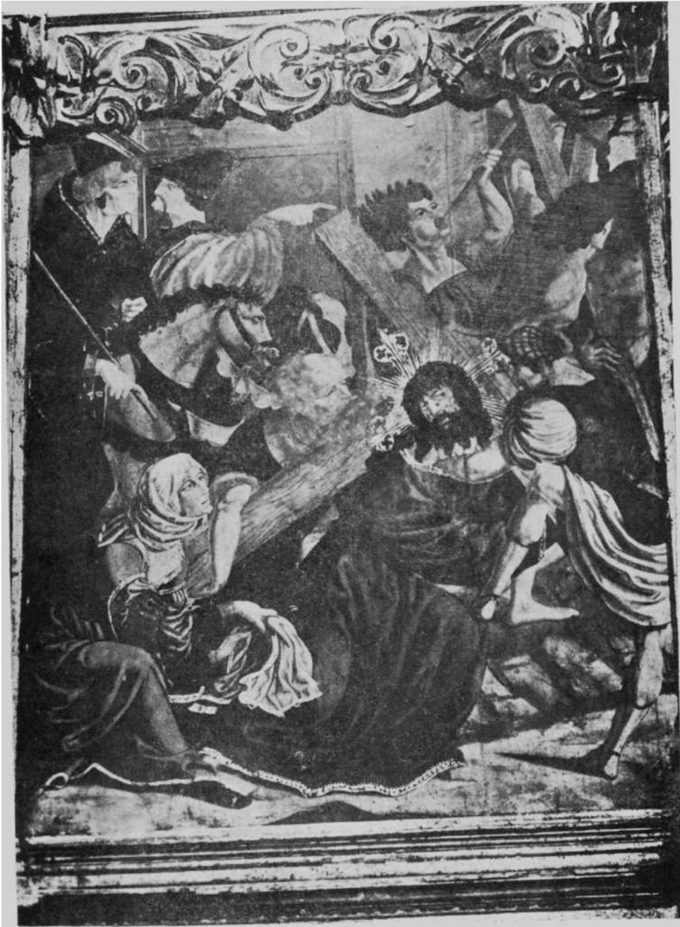
<<Camino del Calvario>>, pintura del retablo del altar mayor de la Parroquia de Cizur Mayor