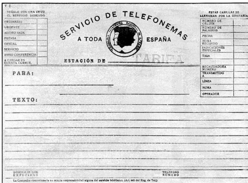
Antiguo impreso utilizado en la estación de telégrafo de Tarifa.

La última bandera de la patria española que allí ondeó fue en la administración principal de comunicaciones de aquella provincia, de la que yo era Jefe, siendo arriada por mí a las nueve menos cinco minutos de aquel triste día. Ella guarda las lágrimas que derramé en aquellos momentos de profundo dolor y que como profunda reliquia, la he conservado hasta hoy, que te la entrego gustosísimo para que la poseas como recuerdo