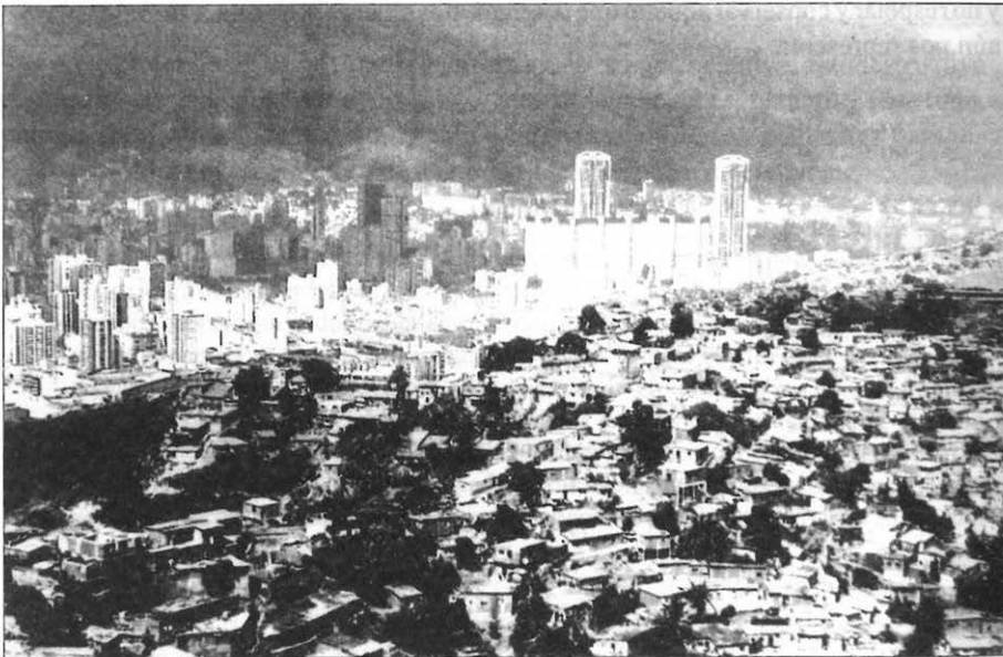
Ilustración 2. El crecimiento urbano y sus contrastes. Vista de Caracas, Venezuela.