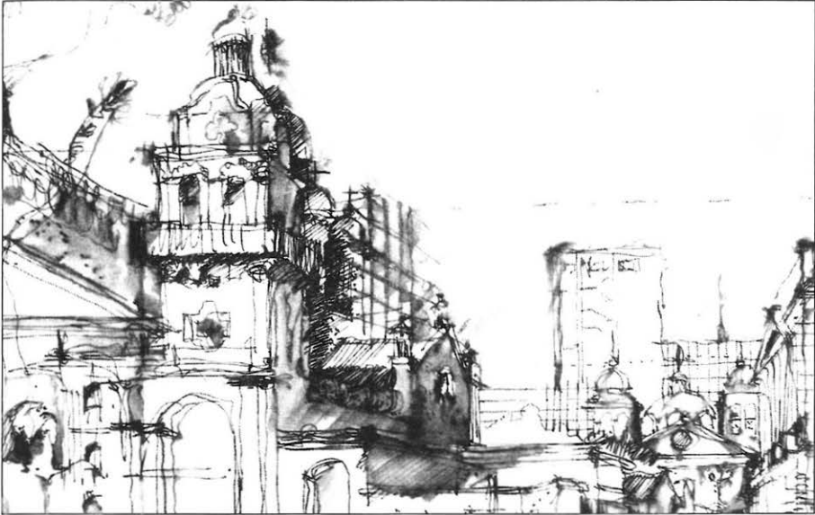
Ilustración 3. Los momentos del pensar y hacer del hombre materializados en la arquitectura y sus contrastes. Dibujo de Mónica Bertolino, «Concierto de mediodía» (detalle). ( Córdoba, ciudad y desarrollo , n° 2, año I, nov. 1994, p. 15).