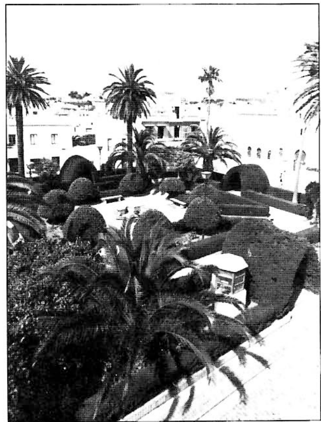
Plaza donde se pregonaron los Ordenanzas.

24) Otro si, Porque las diferencias y quisiones que cada dia se ofrecen entre los Vaqueros que guardan el ganado Vacuno y tengan orden por donde se rijan y gobiernen en gozar los pastos publicos y términos Valdios de esta Villa y de aqui adelante ninguno pueda pretender que tiene fecho particular y apropiado para su ganado con que otro no pueda entrar lo cual es contra derecho, ordenamos y mandamos que ninguno