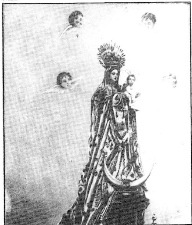
Virgen de la Luz.

convite a la Santa Comunidad de la Santísima Trinidad y que sirva convocar al venerable Clero para que en forma de tal asista, y habiendo salido los referidos caballeros diputados a practicar esta diligencia, volvieron a este Cabildo manifestando con la deliberación de la Ciudad y que está pronto a convocar al Clero y que la Ciudad determine el día y que además por tan ardiente celo da las gracias al Cabildo en cuya vista acuerda continuen los dichos caballeros su diputación en la forma expresada y como quiera que no se sabe las disposiciones que tendrán que dar los Hermanos Mayores los dichos caballeros quedaron de conformidad en el día que se ha de salir por Nuestra Señora y desde luego los dichos cuatrocientos reales, contra el caudal de Propios y que se despache de ello libranza contra el Mayordomo de Propios y a favor de los Hermanos Mayores de la Hermandad de Ntra. Sra. de la Luz .