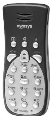
Imagen 1. Fotografía de un teléfono móvil que facilita el acceso a personas con problemas de motricidad fina, dificultades en la visión, a las personas mayores y a quienes necesitan apoyos cognitivos.