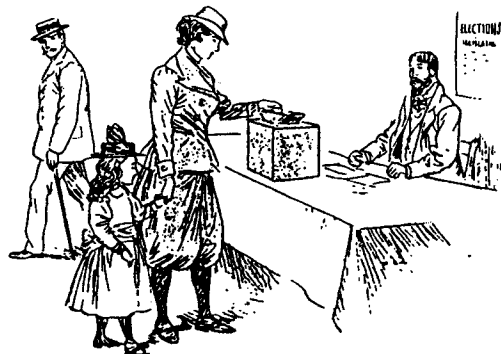
La femme future. La mère initiant sa fille aux devoirs de l'existence. 1

Enfin, cette femme arrogante réclame le droit de vote, revendication choquante pour la Droite conservatrice, bien sûr, mais inquiétante pour la Gauche républicaine qui craint que l'électorat féminin, endoctriné par le clergé catholique, n'exprime majoritairement un vote réactionnaire. On peut par progressisme refuser (provisoirement) le droit de vote aux femmes! En pratique, les revendications des suffragettes se heurtent donc à une union sacrée de la classe politique, consciente de la montée des périls.