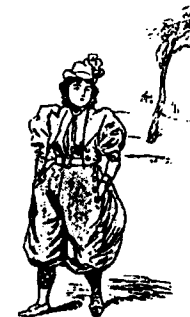
Les mains dans les poches. Culotte flottant au vent 1

Bref, pour les caricaturistes la femme en culotte redonne vie à un thème classique, celui du monde à l'envers : la femme déguisée en homme apparaît