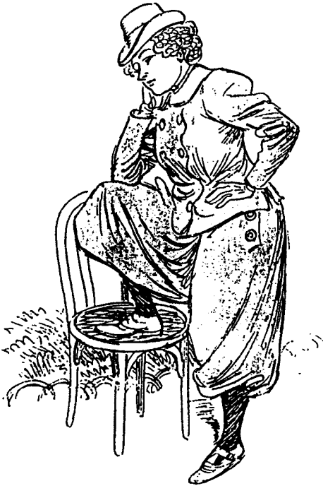
Poses et gestes masculins: Accoudement familier et jambe relevée. 1

comme une usurpatrice, qui subvertit les rôles sociaux et instaure à l'intérieur du couple une nouvelle hiérarchie. L'émancipation de la femme n'est pas conçue comme une marche vers l'égalité des sexes, mais comme une revanche humiliante sur les hommes.