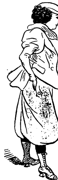
Poses et gestes masculins: Les mains dans les poches.

le cigare), bénéficie peut-être de l'indulgence du milieu littéraire et artistique, mais suscite malaise et réprobation.