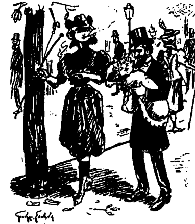
Canne à la main, cigarette à la bouche, culotte au...tre part, le voilà le féminisme de demain. 1

Il y a plus grave: la femme émancipée refuse le fardeau de la maternité, et sur les boulevards c'est le pauvre mari qui doit se charger de Bébé. On voit la portée de cette dénonciation : la culotte produit des mères dénaturées, des mantes religieuses, dévoreuses de mâles.