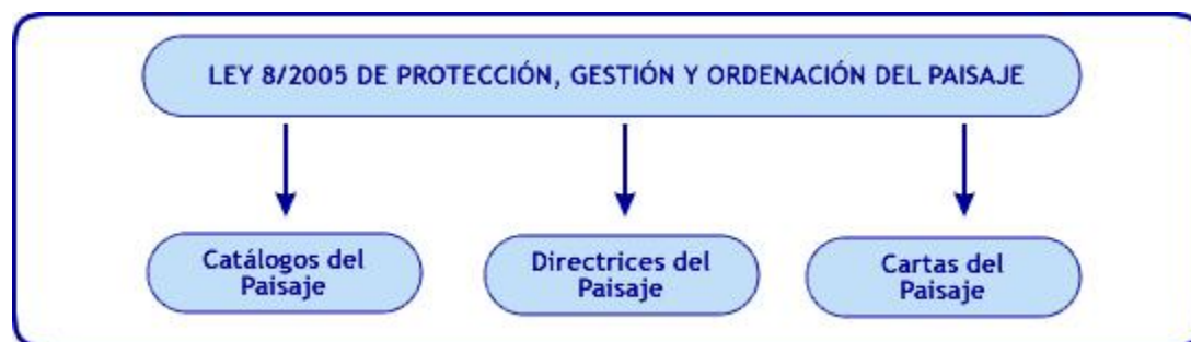
Figura 1: Instrumentos de gestión de la Ley del paisaje.

Los Catálogos del Paisaje se conciben a modo de diagnóstico de su estado. Por su parte, las Directrices del Paisaje parten del diagnóstico contenido en los catálogos, estableciendo, de este modo, recomendaciones y nuevas formas de actuación para obtener los objetivos de calidad paisajística previstos. Y, finalmente, las Cartas del Paisaje favorecen los acuerdos entre administraciones, entidades cívicas y agentes económicos, con el fin de proteger y gestionar el paisaje de una área determinada (Nel·lo, 2005, 22).