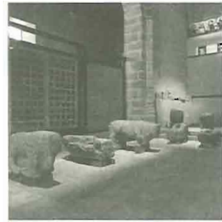
Fig. 3: Conjunto de Martiherrero en el Museo de Ávila

muros donde habían sido reutilizados, y que acabarán constituyendo parte del "fondo antiguo" del Museo 11 .