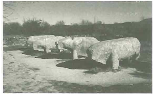
Fig. 2: Los Toros de Guisando

de lo expuesto, es decir: se traslada la institución, instalándola donde resulte más conveniente, priorizando el contexto original. La novedad de las últimas décadas es que para hacer museo no sea necesario traslado alguno, sino que algo -cualquier cosa- puede ser museo en su sitio, si se musealiza. Parece un trabalenguas, pero tiene su importancia, porque no hay que perder de vista la definición de museo y las funciones que se esperan de un museo.