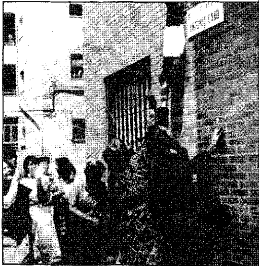
Los organizadores del homenaje están muy satisfechos con la ayuda conseguida