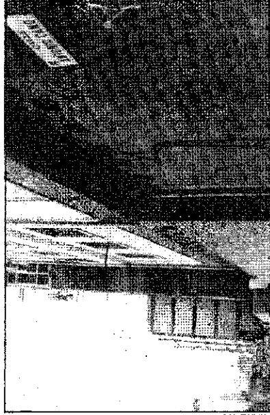
Ayer quedó inaugurada la calle que lleva el nombre de Antonio Cano