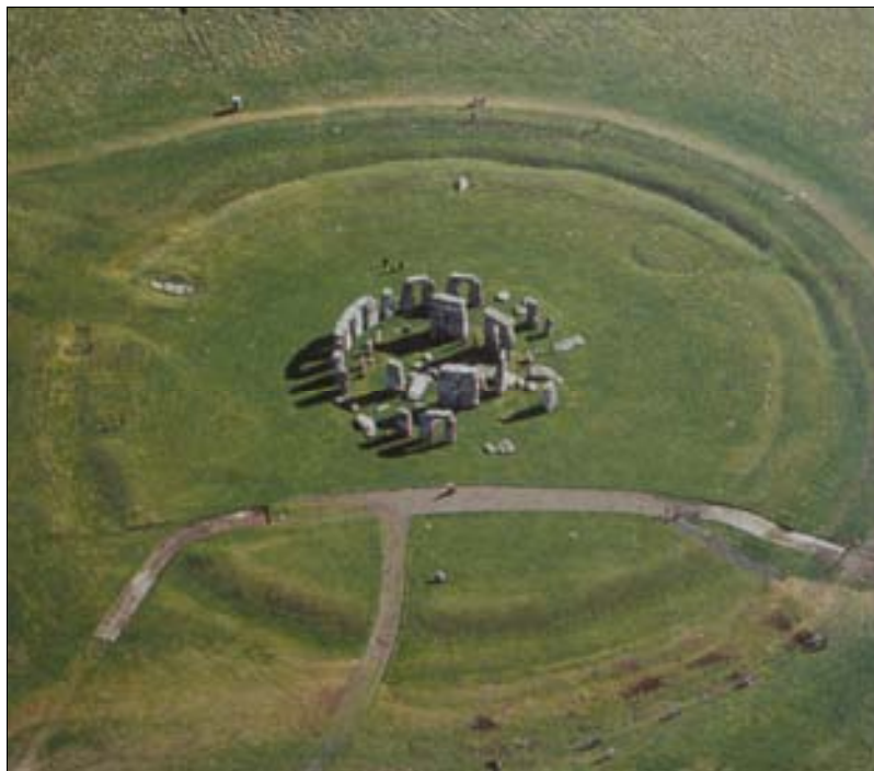
■ Fig. 1. Wiltshire (Inglaterra). Crómlech de Stonehenge (ss. XIV-XII a. C.).