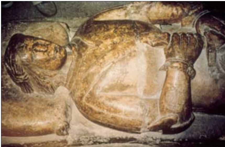
■ Fig. 6. Burgos. Catedral. Caballero de la Banda (s. XV).