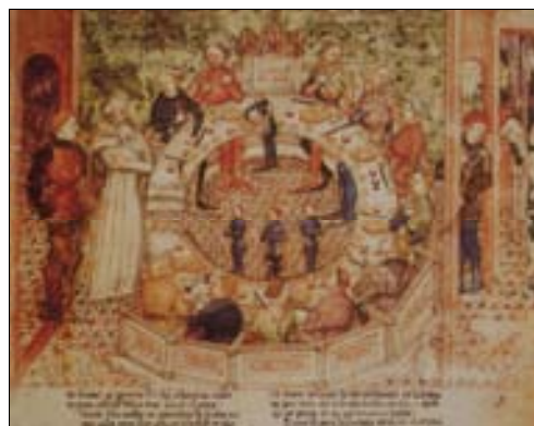
■ Fig. 3. El "Sital Peligroso". Queste del Saint Graal et Mort Artu , París, BN, Ms. Fr. 343 (h. 1370-80).