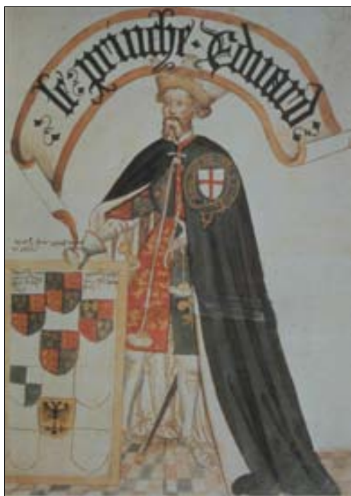
■ Fig. 8. El Príncipe Negro en hábito de la Jarretera. William Bruges's Garter Book , Londres, BL Stowe MS 594 (h. 1440-50).