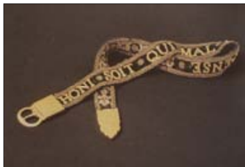
■ Fig. 7. Divisa de la Orden de la Jarretera.