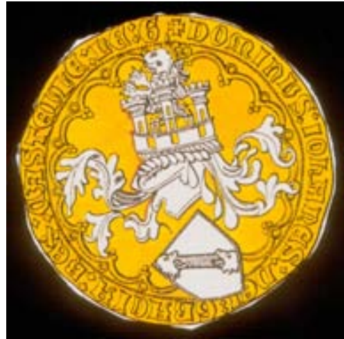
■ Fig. 5. Divisa de la Banda Real de Castilla.