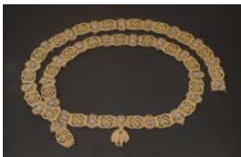
■ Fig. 10. Collar del Toisón de oro.