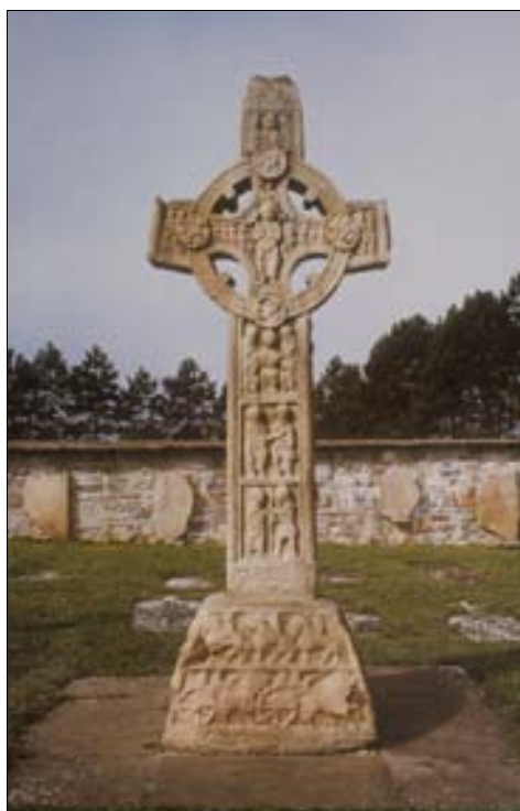
■ Fig. 2. Irlanda. Cruz de Clonmacnoise (s. X).