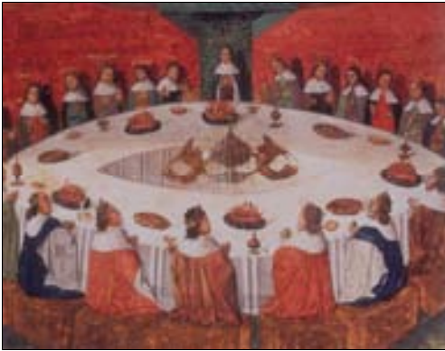
■ Fig. 4. Aparición del Santo Grial. Lancelot , París, BN, Ms. Fr. 112 (h. 1470).