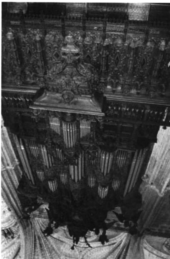
Organo del lado del Evangelio de la Catedral de Sevilla.