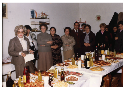
8.3.2.- Acto de inauguración de la sede social de las Amas de Casa de Sangüesa, calle del Mercado, s/n, en febrero de 1979.