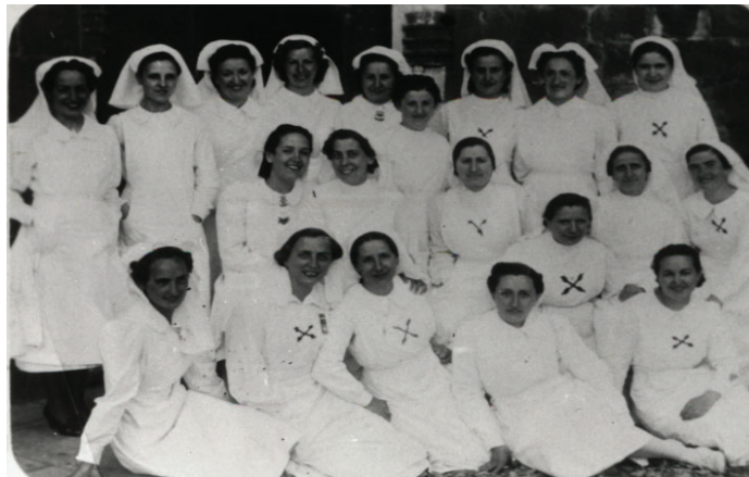
Grupo de enfermeras sangüesinas en el Hospital Militar de Sangüesa durante la guerra civil 1936-1939.