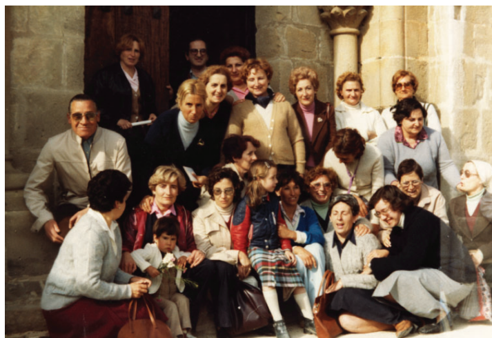
8.3.5.- Excursión en San Adrián de Vadoluengo.