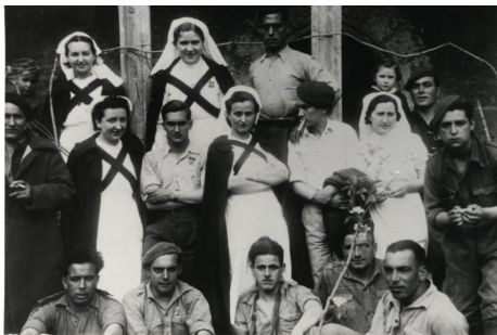
8.2.9.- Enfermeras y militares en el claustro del Carmen, en el Hospital. Guerra Civil (1936-1939).