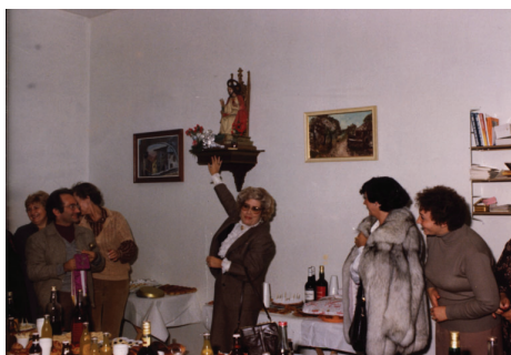
8.3.3.- Acto de inauguración de la sede social de las Amas de Casa de Sangüesa, calle del Mercado, s/n y entronación del Sagrado Corazón de Jesús, en febrero de 1979.