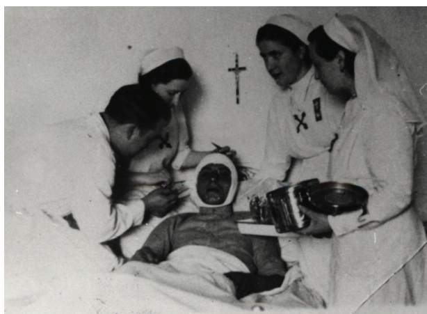
8.2.11.- Practicante y enfermeras del Hospital de Sangüesa realizando una cura a un soldado herido en la guerra civil. (1936-1939).