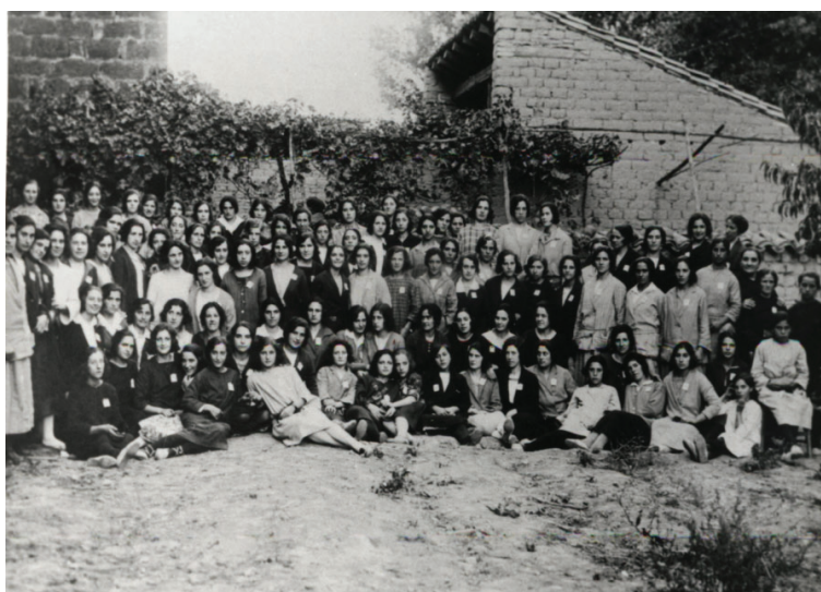
8.2.7.- Ejercicios de mujeres de la V.O.T.