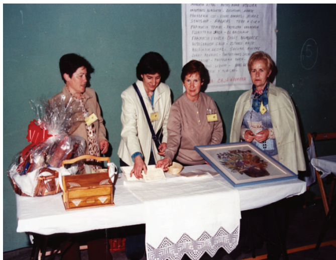
8.3.8.-Premios de la concentración de bolillos en abril de 1992.