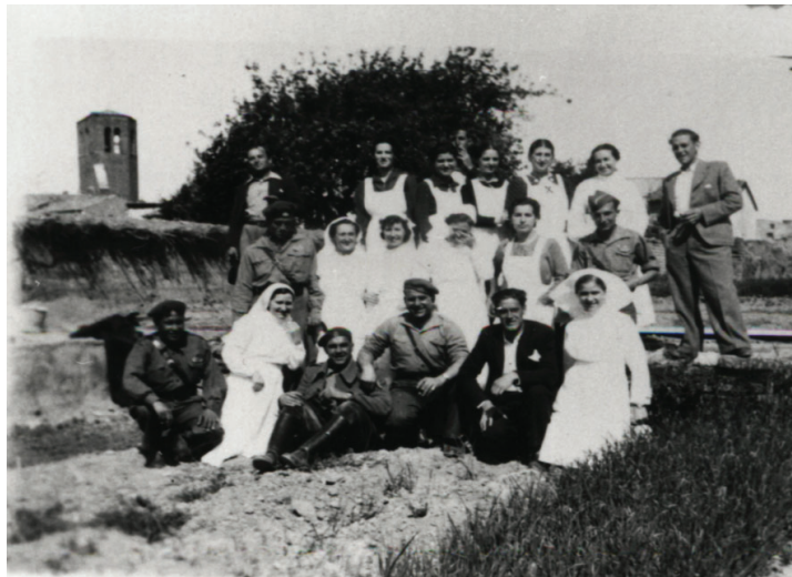
8.2.8.- Grupo de enfermeras y militares en la huerta del Hospital. Guerra Civil (1936-1939).