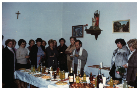
8.3.1.- Acto de inauguración de la sede social de las Amas de Casa, calle del Mercado, s/n y entronación del Sagrado Corazón de Jesús, en febrero de 1979.