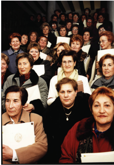
8.3.7.- Jornadas sobre Gestión Familiar. 18 de enero del 2000.