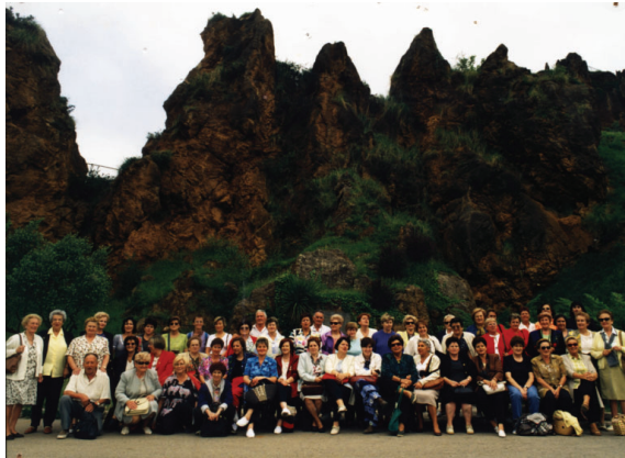
8.3.6.-Excursión al parque de Cabárceno, Cantabria, junio de 1997.