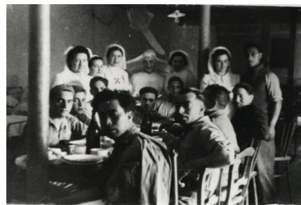
8.2.10.- Enfermeras y militares en el comedor del Hospital. Guerra civil (1936-1939).