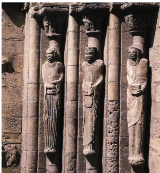
Las tres Marías. Portada de Santa Maria.