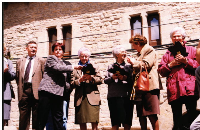
8.3.9.-Entrega de premios de la concentración de bolillos, 1992.