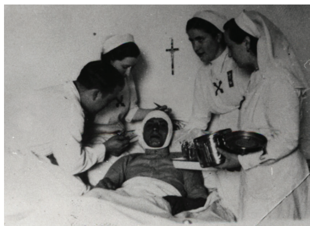
8.2.11.- Practicante y enfermeras del Hospital de Sangüesa realizando una cura a un soldado herido en la guerra civil. (1936-1939).