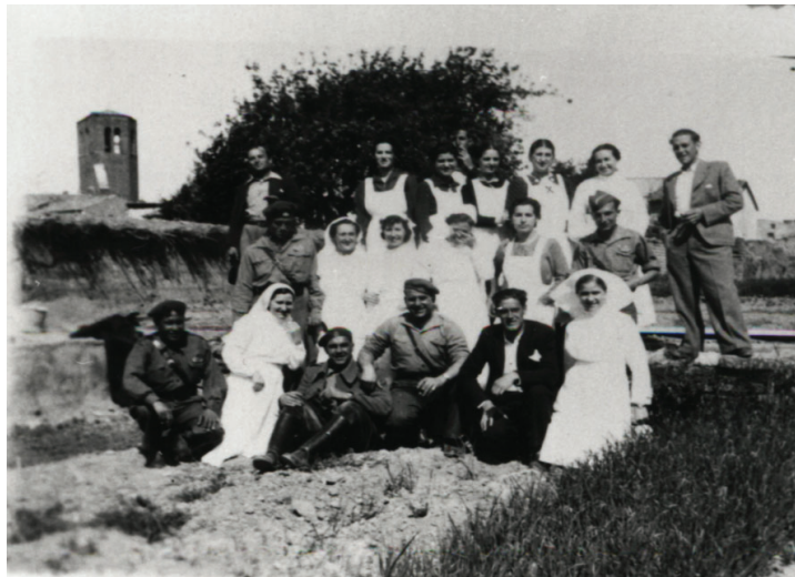
8.2.8.- Grupo de enfermeras y militares en la huerta del Hospital. Guerra Civil (1936-1939).