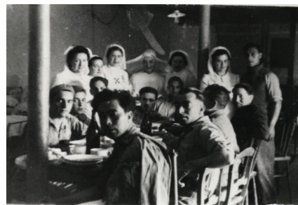
8.2.10.- Enfermeras y militares en el comedor del Hospital. Guerra civil (1936-1939).