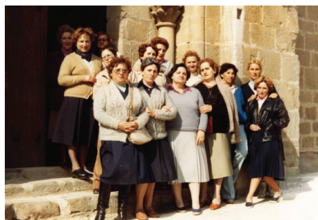
8.3.4.- Grupo de mujeres en San Adrián de Vadoluengo.