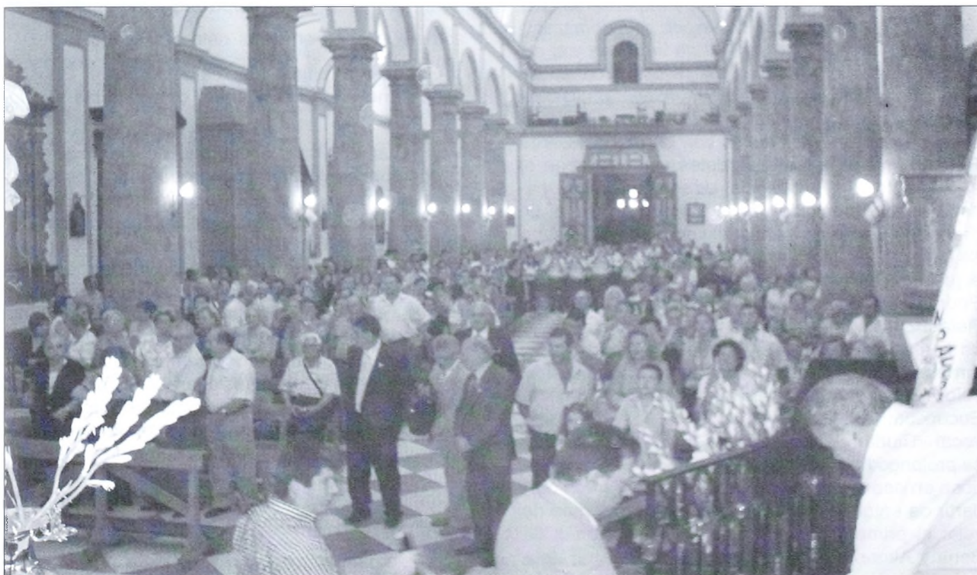
El amplio templo parroquial estuvo abarrotado de fieles.