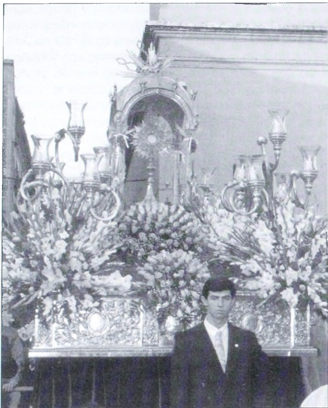
El Santísimo Sacramento procesiona en Berja portado en el expositor obra del orfebre valenciano Salvador Peris Bacete en 1959. Foto: Procesión del Corpus Christi en 1993.

caristía es la fuente, el centro y el culmen de toda la vida de la Iglesia. Como memorial de la pasión y de la resurrección de Cristo Salvador, como sacrificio de la Nueva Alianza, como cena que anticipa y prepara el banquete celestial, como signo y causa de la unidad de la Iglesia, como actualización perenne del Misterio pascual, como Pan de vida eterna y Cáliz de salvación, la celebración de la Eucaristía es el centro indudable de la fe católica.