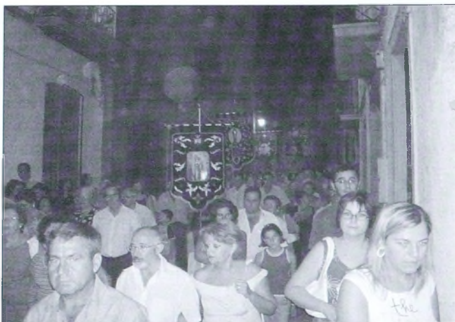
Las hermandades solemnizaron con su presencia el cortejo. En la foto la procesión pasando por la calle del Agua.