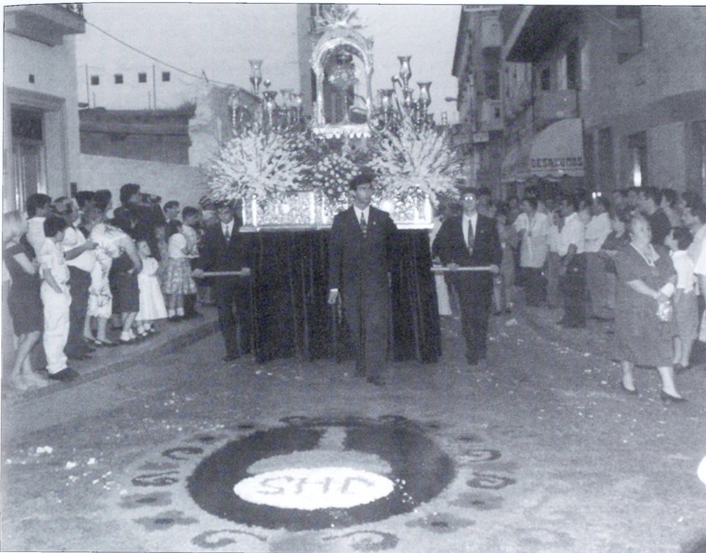
Para la procesión del Corpus Christi se elaboran artísticas alfombras que adornan el recorrido. Foto: Procesión del Santísimo Sacramento a su paso por la calle Manuel Salmerón en 1994.