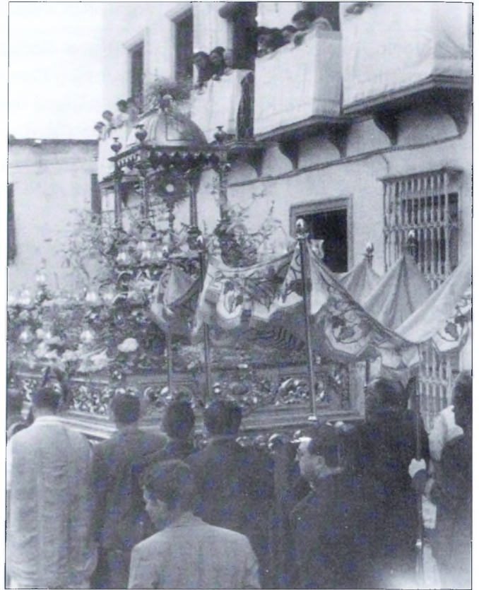
Procesión del Corpus en 1959. El palio es portado por los miembros de la Adoración Nocturna. La custodia se colocó en el Templete que da cobijo a la Virgen de Gádor en su camarín sobre el trono de «La Soledad».

La sección celebró su propia Fiesta de Espigas en el santuario de Ntra. Sra. de Gádor, en la noche del trece al catorce de junio de 1959, a la que asistieron un grupo de jóvenes y dos adoradores antiguos.