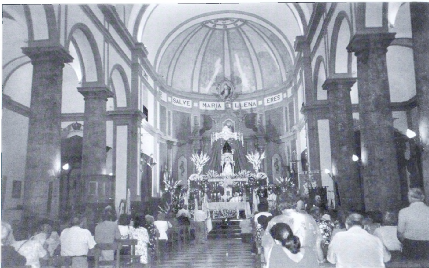
Un momento de la celebración eucarística del centenario, presidida por al imagen de la Virgen de Gádor.