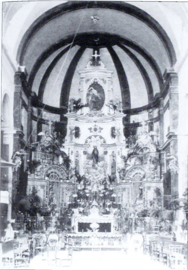
La devoción al Sagrado Corazón de Jesús era muy intensa en Berja a principios del siglo XX, su imagen presidió en algunas ocasiones el retablo de la parroquia, destruido en 1936.

ta (Tabernas) 18 . Actualmente está en proceso de beatificación.