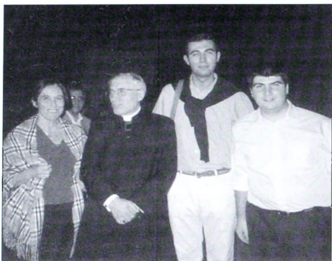
Miembros de la Sección de Berja junto al Cardenal Rouco, en septiembre de 2002.

los actos organizados por la sección o aquellos en los que ha participado: