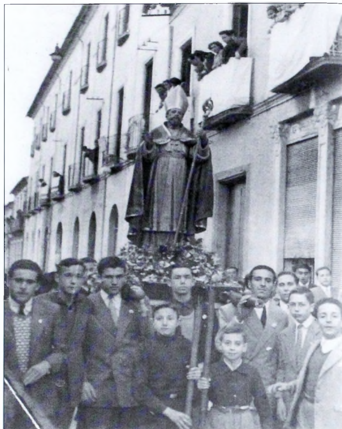
San Tesifón, patrono de Berja y actual titular de la sección.