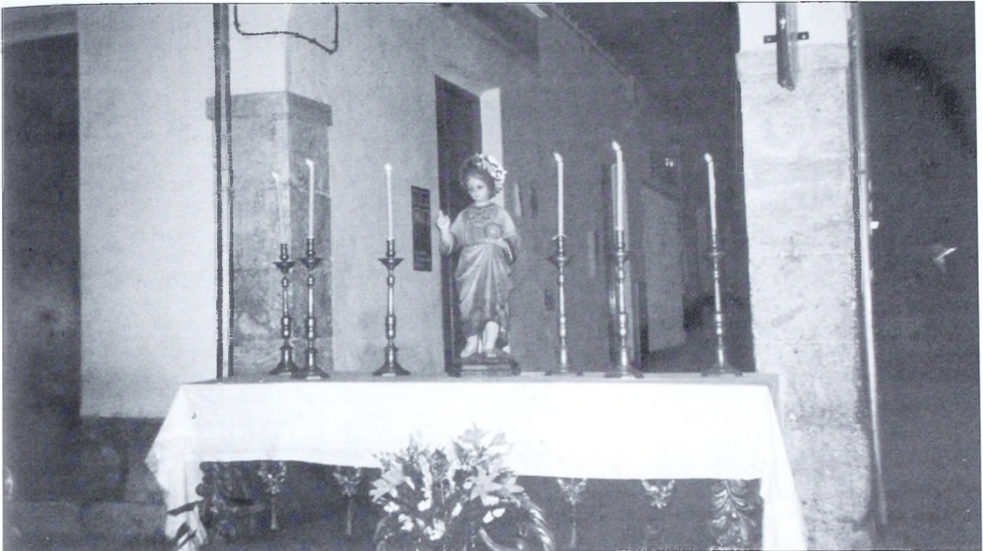
La imagen del Niño Jesús presidió uno de los altares para la procesión.

de San Pedro que fue utilizado como templo durante las obras de la parroquia.