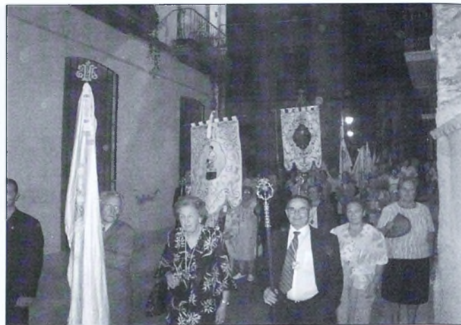
Las banderas de las distintas secciones cerraban el desfile procesional.

1904, y el párroco realizó una emotiva homilía en la cual reflexionó sobre el momento histórico en el que surgió la Adoración Nocturna en la localidad, contextualizando la situación de la Iglesia de aquel momento.