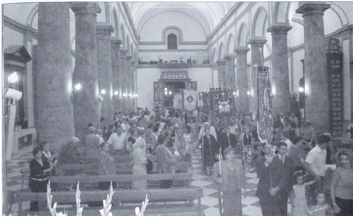
Las Hermandades entrando a la Parroquia de La Anunciación tras la procesión de banderas.