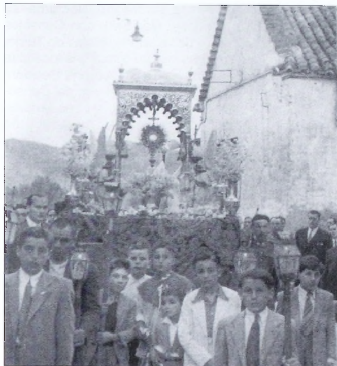
Procesión del Corpus Christi en Berja en los años cuarenta del siglo XX, a su paso por la confluencia de las calles Manuel Salmerón y Cura Antonio Martín. La custodia es portada en las andas de la Virgen de Gádor.