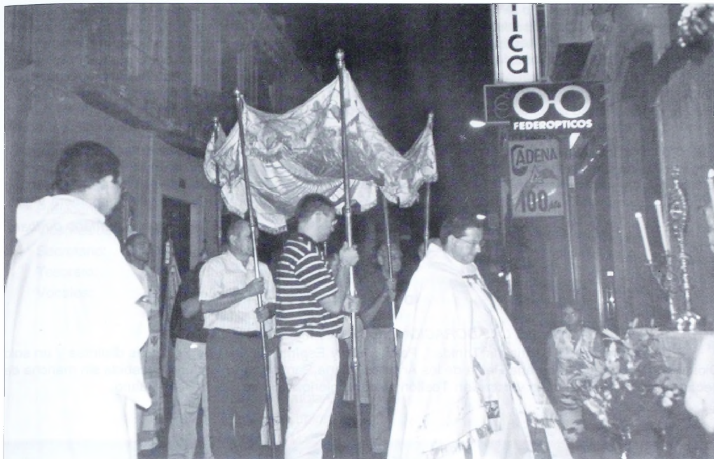
Uno de los altares confeccionado para la procesión en la calle Manuel Salmerón.

la Sección, solemnizándola con la asistencia de la misma a la Misa mayor del siguiente día en la iglesia parroquial con exposición de su divina majestad y sermón; sacar pública y procesionalmente al Santísimo Sacramento en la tarde del mismo día y celebrar en su noche la primera Vigilia, confesando y comulgando los congregantes.