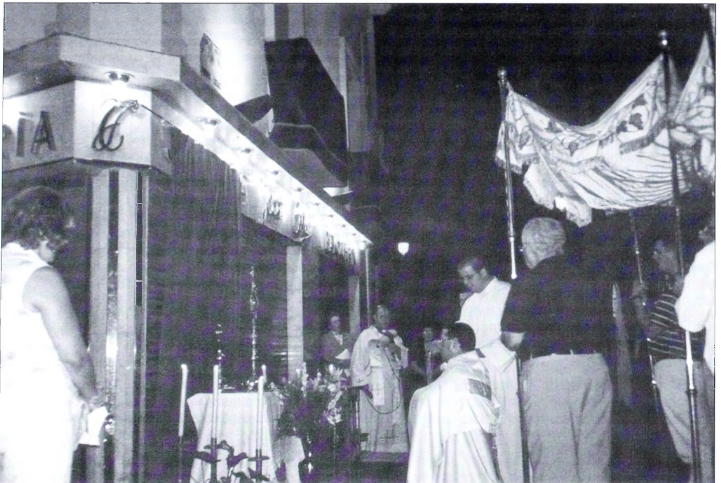
El Santísimo Sacramento es colocado en el último de los altares, erigido en la calle Puente Lozas.

En el nombre de la Santísima Trinidad, Padre, Hijo y Espíritu Santo, tres Personas distintas y un solo Dios verdadero; de la Soberana Reina de los Ángeles, María Santísima de Gádor, concebida sin mancha de pecado original; del augusto varón San Tesifón; y de la gloriosa Beata Sor Josefa Ruano.