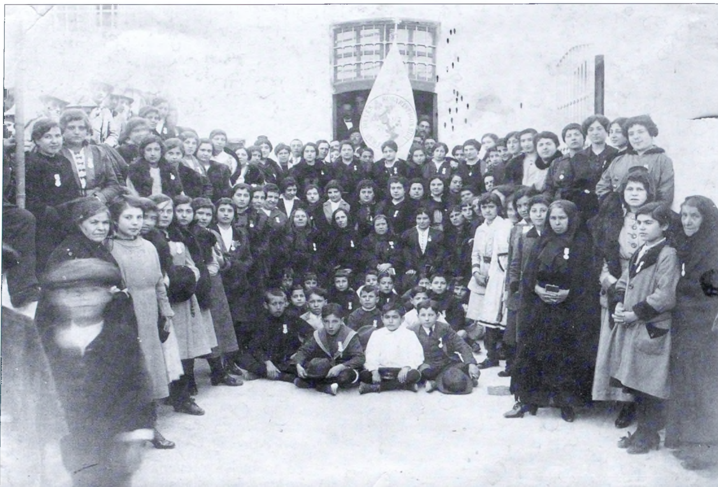
Reunión de las damas de los «Jueves Eucarísticos» en la segunda década del siglo XX.

22 de diciembre de 1945, el Consejo Diocesano de la Adoración Nocturna organizó 19 vigili­as en la capital y el mismo número en todas las secciones de la archidiócesis 23 .