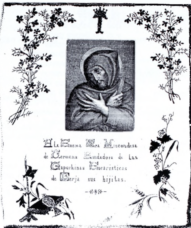
Portada de la Visión Seráfica , con dedicatoria