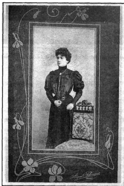
Retrato femenino. (Augusto Schimmer, Bogotá, 1905).

El rapto normalmente conducía al matrimonio. Ante rígidas estructuras sociales, una pareja optaba por huir y publicitar sus