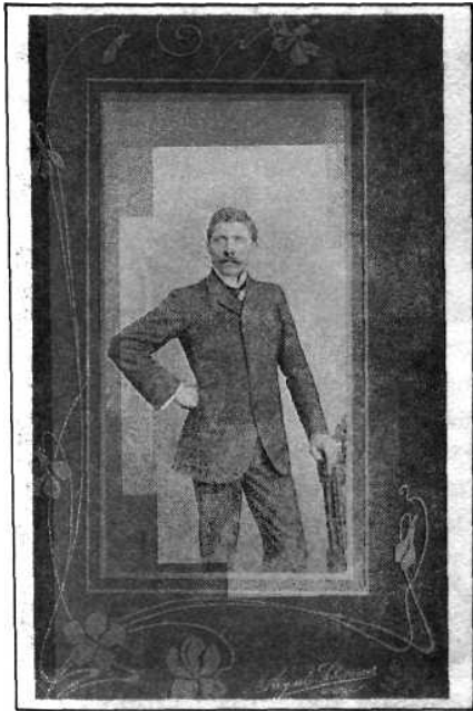
Retrato masculino. (Augusto Schimmer, Bogotá, 1905).

mato de las grandes ciudades llevar vida de pareja, constituyendo una familia. Normalmente no hay el recurso a la justicia, y ésta no se empeña en perseguir parejas de enamorados en las conflictivas ciudades. Ya huidos, con el curso de los años los hombres mitigan su rencor. Ordinariamente una serie de ritos (saludos, regalos, visitas) los reconcilian con sus familias y lugar de origen. No obstante, algunos padres se niegan a reconsiderar su actitud y optan por llevar una vida plagada de amargura. En la época colonial no existía la posibilidad de ocultarse. Quienes huían lo hacían para acudir a la comprensión de la justicia eclesiástica o civil. Como ya lo observé, pensaban que la beligerancia del hecho y la publicidad de los sentimientos amminorarían la oposición de los padres y permitirían la unión.