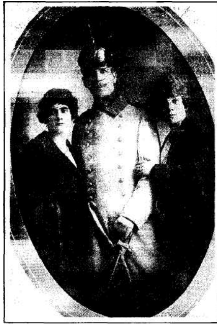
Militar acompañado de dos damas, Bogotá, 1920.