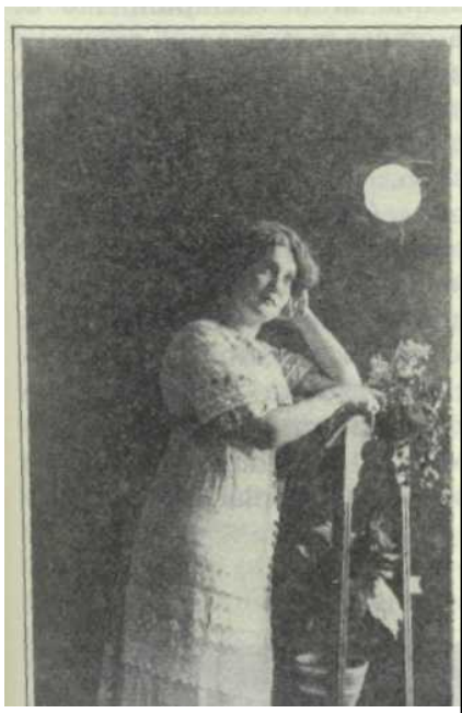
Retrato femenino. Medellín, 1913.

Pablo Rodríguez Profesor Asociado de la Universidad Nacional- Medellín