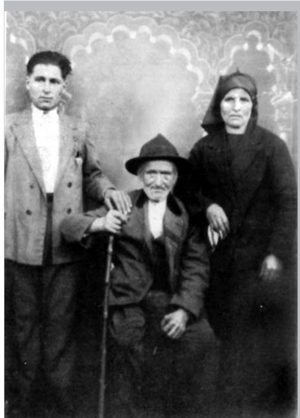
Emigrante en Cuba cos seus pais nunha aldea de Chantada. A foto fíxose na viaxe de retorno do mozo, está publicada en Soutelo Vázquez, 2006, Labregas, emigradas estraperlistas e represaliadas, Concello de Valga.

[...] El labriego gallego sufre las consecuencias de una mala administración y satisface, a costa de penosos sacrificios, los exorbitantes impuestos que sobre la propiedad territorial gravitan [...] Emigrando desesperado cuando la extrema situación de miseria le imposibilita permanecer en la aldea [...] Todas las causas que en España sustentan a la emigración están recrudescidas en Galicia, numerosos obstáculos dificultan el desarrollo de la agricultura: la desunión lo esteriliza todo, la más despiadada usura lo invade todo mientras las clases acomodadas retraen cualquier apoyo a la clases proletaria... se desconoce el espíritu de asociación y si alguna protección existe, no se auxilian ni se asocian [...] El poder rural abusa