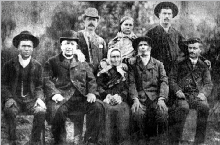
Familia labrega de Moeche (Ferrolterra) cos fillos emigrados. A foto fíxose como lembranza da viaxe dos 'cubanos' á súa aldea de orixe, está publicada en Núñez Seixas e Soutelo Vázquez, 2004, As cartas do destino, Galaxia, Vigo.

Porén, algúns deses labregos protestaron, por exemplo na comarca de Valdeorras, e resistíronse a pagar os impostos coa forza da rebeldía xusta contra dos abusos dos poderosos locais e dun Estado alleo á terra nai, segundo explicaba o propio Lamas: