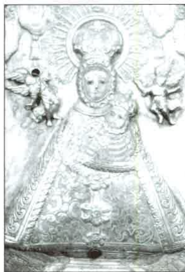
Peto 7. Detalle.

Caixa, en forma e medidas, igual cãs anteriores; de madeira lisa, sen molduras, estoxiño facendo de pedestal e coas súas portañas. A chapa ou lamia preséntase co dosel acostumbrado e cortinaxe colgante algo menos ampulosa, acollendo a imaxe vestida da Virxe co Neno no colo no brazo esquerdo, entre blandós acesos. A imaxe menos pro-jectada, con filigrana e colar repuxados. Os anxos sobrepostos e pomba en alto, con lema Nª Sª DE LOS MILAGROS. So-bre pedestal con máis forma de tal, e anagrama de MARÍA. Unha vez máis o marco debe de estar atobando o contraste, que non logramos ver.