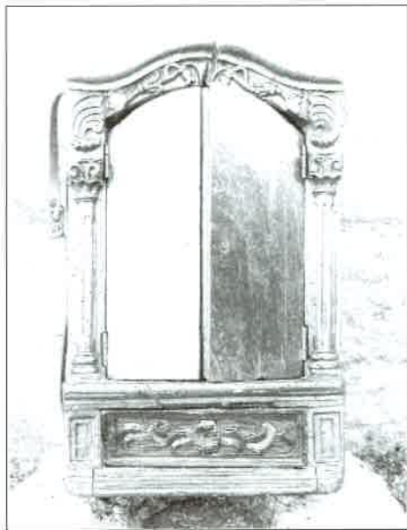
Peto 1. Cerrado. ▲

anxos coligantes sobrepostos e dourados; encima, a pomba do Espírito Santo.