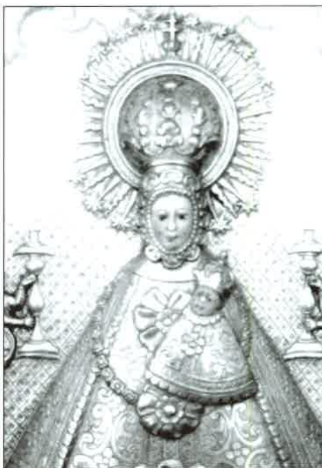
Peto 4. Detalle.