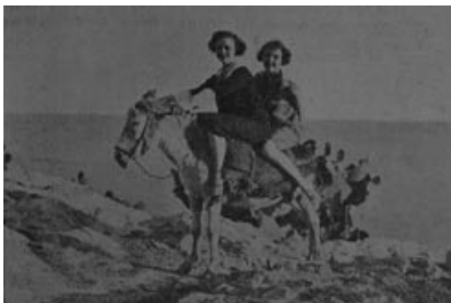
Distintas instantáneas captadas durante el rodaje de la película Manon Lescaut en Málaga, editadas en el semanario local Vida Gráfica (nº 3, 16-III-1925).