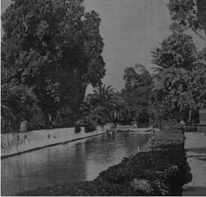
La finca El Retiro de Churriana a mediados de los años veinte: uno de los escenarios de nuestra provincia donde transcurrió parte de la acción de la película germana Manon Lescaut (1925) y de la británica Dolores ( A Light Woman , 1928).