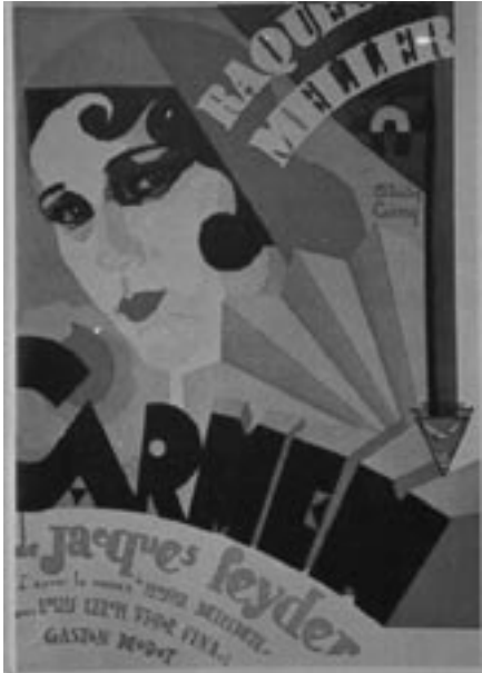
Cartel publicitario de la película Carmen .