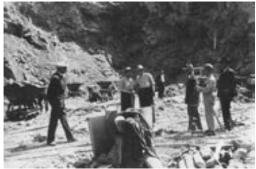
Dos momentos del rodaje de La copla andaluza.