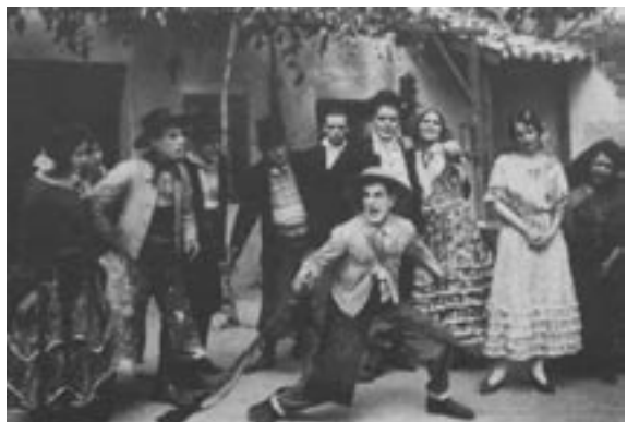
El equipo artístico de Los guapos o gente brava en pleno rodaje.

La película se rodó en exteriores en la Serranía de Ronda, Tánger y Algeciras (Cádiz), mientras que los interiores se grabaron en los estudios de la productora Atlántida en Madrid. El montaje se efectuó en los laboratorios Madrid Film. Cabe señalar que se hicieron copias con subtítulos en castellano, euskera y francés 22 . La cinta fue estrenada en el Teatro Cervantes de Madrid el 19 de mayo de 1925, dos años después de su rodaje. En Málaga se proyectó en el Cine Moderno el 7 de marzo de 1928 23 , fecha realmente tardía con respecto a su exhibición en la capital madrileña, lo que nos lleva a pensar que seguramente se ofreció en otras salas en años anteriores. De cualquier modo, la película pasó sin pena ni gloria por las pantallas de nuestro país, y de hecho es uno de los trabajos menos conocidos de Manuel Noriega, realizador bastante activo dentro del panorama del cine mudo español 24 .