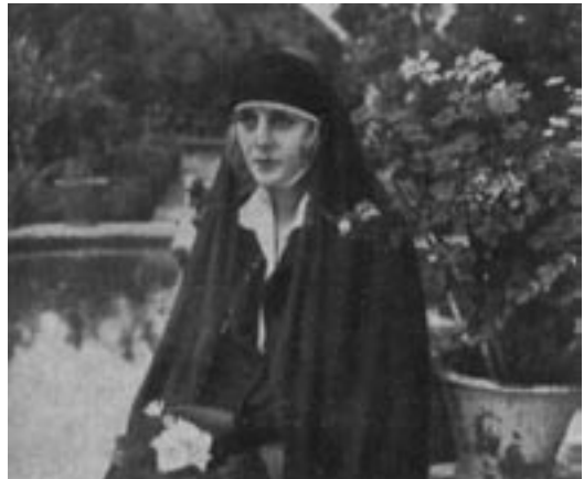
Fotogramas de La sin ventura ( Mundo Gráfico nº 632, Madrid, 12-XII-1923).