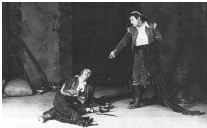
Un momento de la filmación de Diego Corrientes.