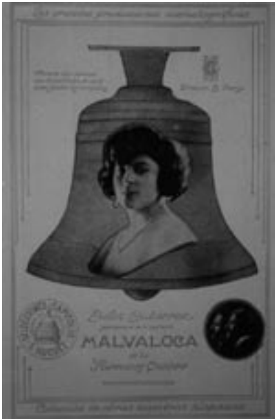
Cartel de la película Malvaloca .

Malvaloca se estrenó en Barcelona, en el cine Tívoli, el 10 de febrero de 1927, y un mes más tarde llegaba a las pantallas de los cines Callao y San Miguel de Madrid, permaneciendo varias semanas en cartel. Su estreno en Málaga tuvo lugar en el Teatro Cervantes el 2 de diciembre de ese mismo año. Las crónicas de la época la calificaron como la película más importante realizada hasta aquellas fechas en nuestro país 52 .