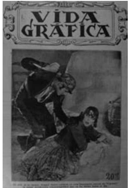
Raquel Meller en una escena de Carmen ( Vida Gráfica , nº 99, 17-I-1927).