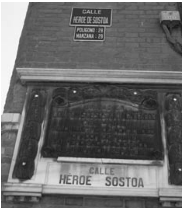
Placa conmemorativa y rótulo de la calle.